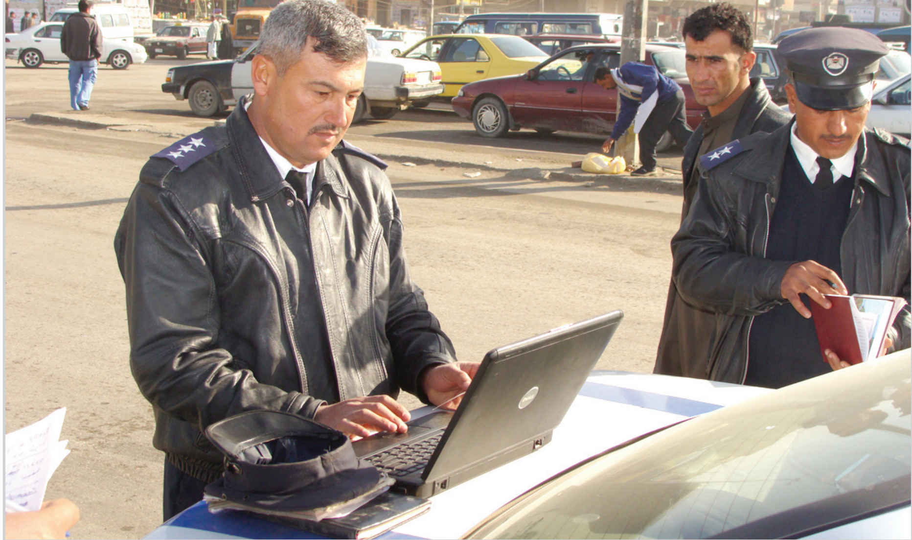
تطبيق الاوراق الرسمية للسيارات الكترونياً...