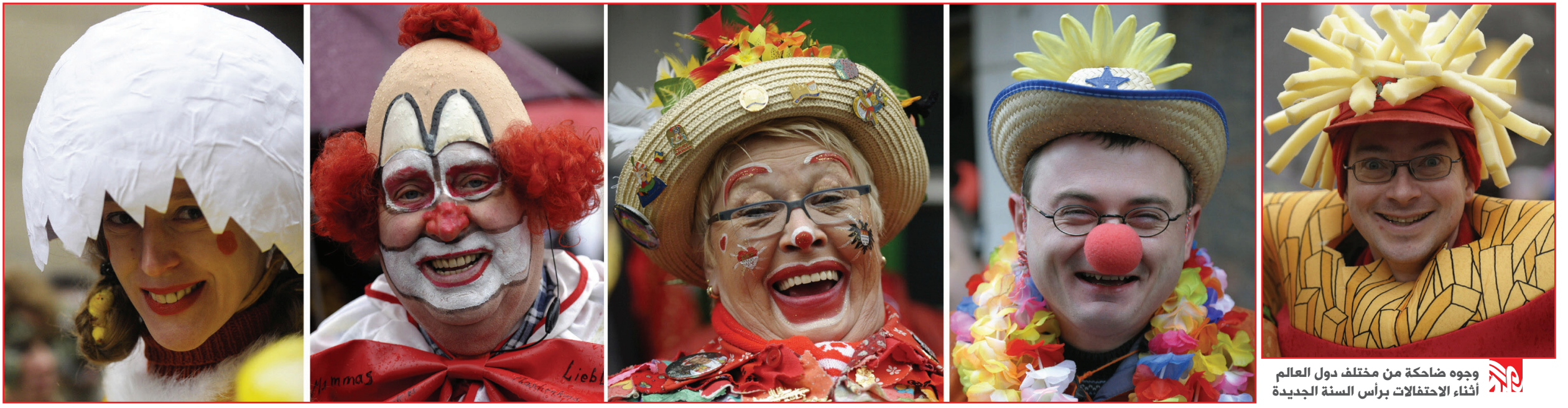
وجوه ضاحكة من مختلف دول العالم أثناء الاحتفالات برأس السنة الجديدة