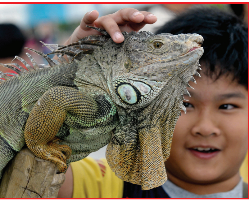
طفل صغير يحاول لمس (إيغوانا) حية عرضت في مدخل مدينة الملاهي في مانايلا كما تعرض أيضا نماذج ديناصورات بالحجم الطبيعي لجذب الزوار أثناء العطلات