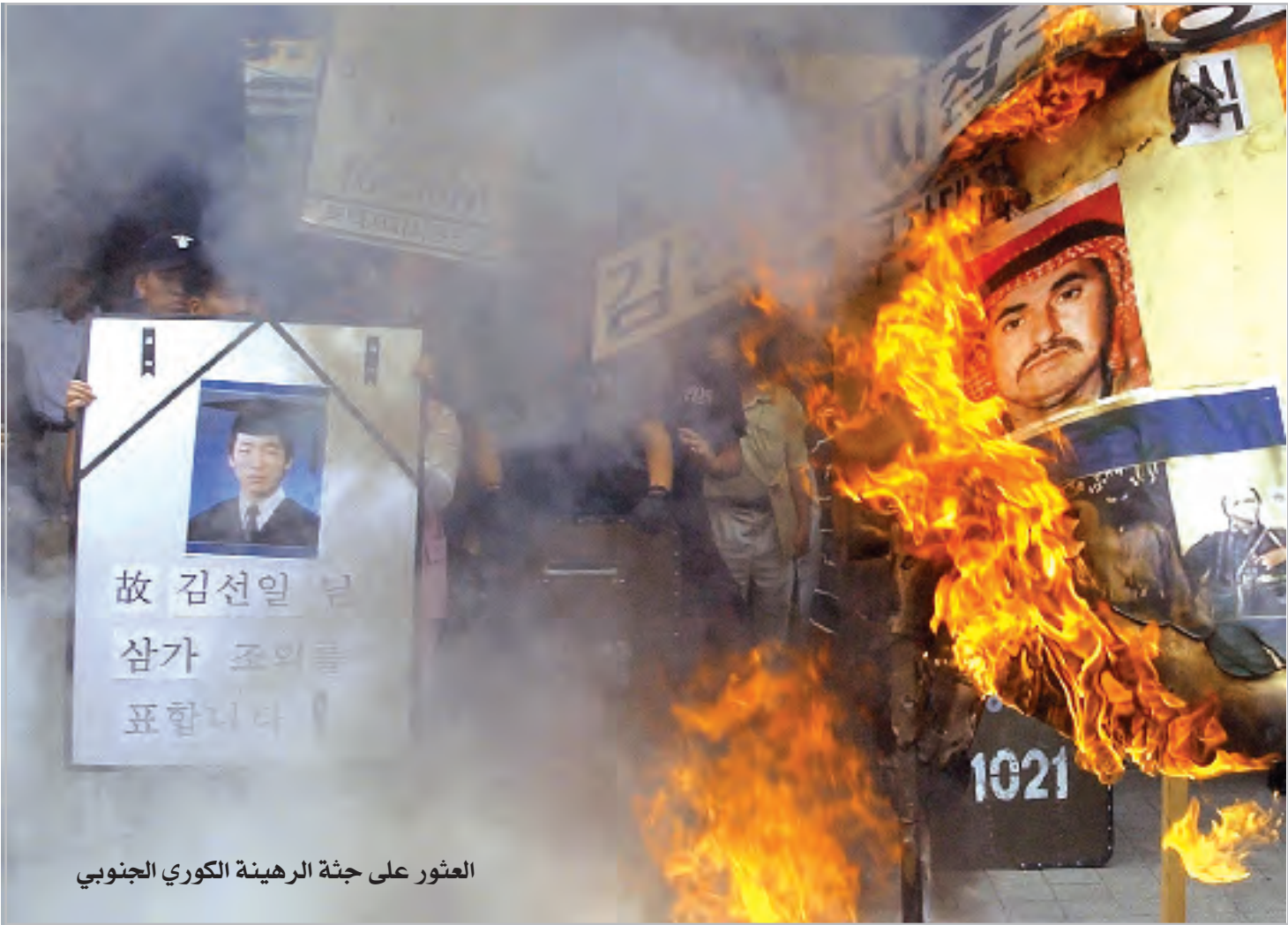
استغور على جثة الرهينة الكوري الجنوبي