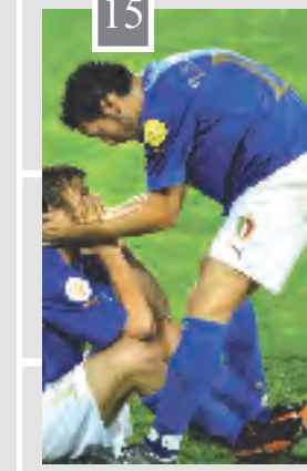
ايطاليا تودع من الدور الاول