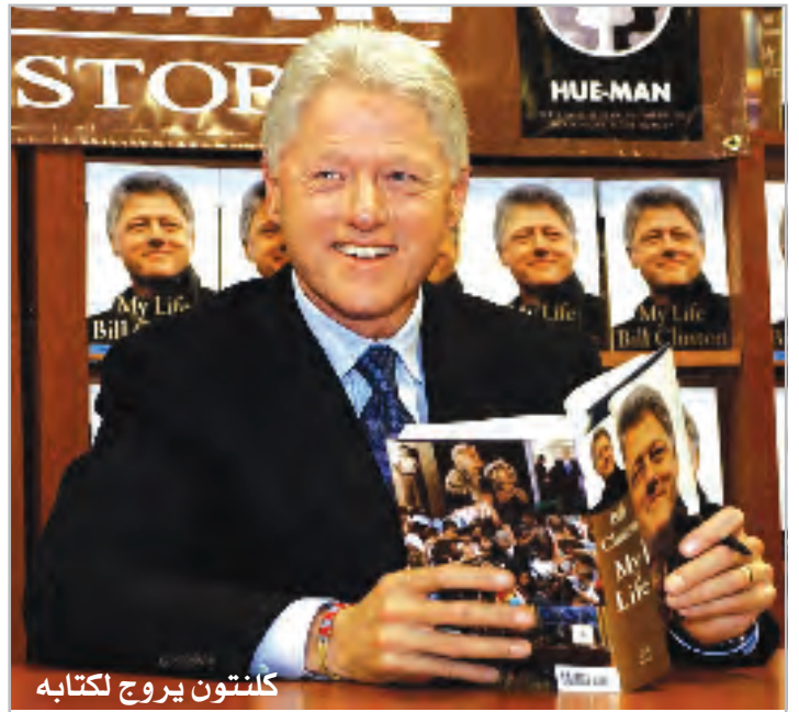
كلنتون يروج لكتابه

والحكومة ستواجه بحزم أي إخلال بالأمن العام بغداد / المدى نقى الناطق الرسمي لرئيس الوزراء ما يروجوه البعض من إشاعات مفرضة مفادها توقف الدوائر الحكومية عن العمل خلال الأيام القادمة تحسبا لوقوع أعمال إرهابية وتخريبية تتزامن مع موعد نقل السيادة إلى السلطة الوطنية.