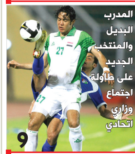
المدرّب البديل والمنتخب الجديد على طاولة اجتماع وزاري اتحادي