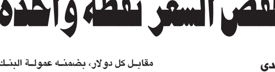
البنوك تقود الأسهم الأوروبية الى أدنى مستوى إغلاق في ٦ أعوام

ويعتبر النقل داخل المدن أو بين المدن من القطاعات الحيوية بينها من القطاعات الحيوية ذات التأثير الواسع على الاقتصاد والتنمية الاجتماعية والبيئية في المجتمع ويمكن اعتبار النقل العام سواء للأفراد أو للضمان بمختلف الوسائل