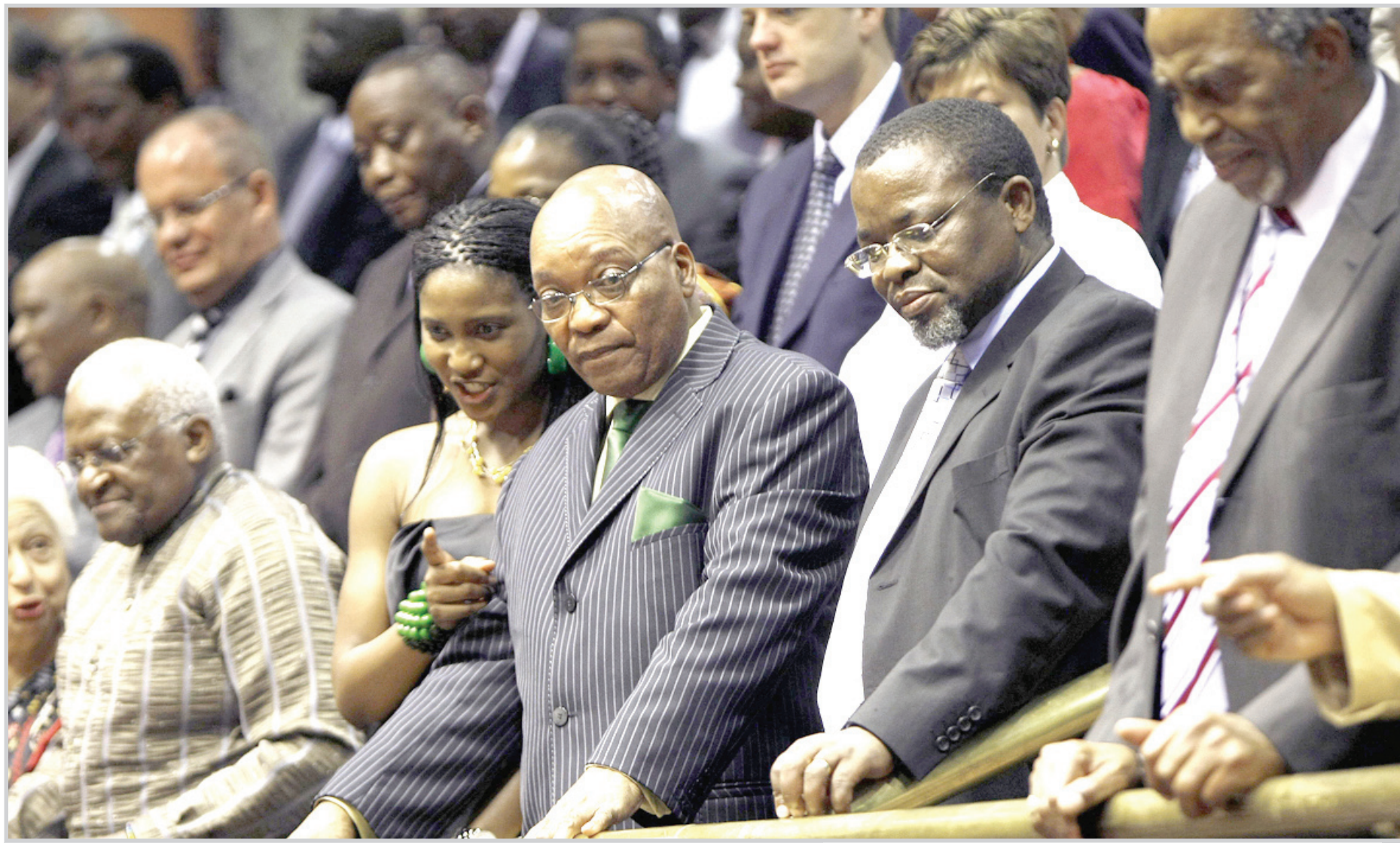
جانب من المؤتمر الوطني لحزب جنوب أفريقيا الحاكم