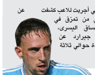
عن الأشعة التي أجريت للاعب كشفت عن أنه يعاني من تمزق في أربطة الساق اليسرى، وسيغيب جيرارد عن الملاعب لمدة حوالي ثلاثة أسابيع.

ثلاثة أسابيع في الأقل بسبب الإصابة في أربطة الساق، واضطر جيرارد بسبب الإصابة للخروج من الملعب بعد ١٦ دقيقة فقط من بداية المباراة التي خسرها ليفربول أمام ليفرتون صفر/١ في نهاب دور الستة عشر من بطولة دوري أبطال أوروبا.. وقال المتحدث باسم ليفربول: الأشعة التي أجريت للاعب كشفت عن أنه يعاني من تمزق في أربطة الساق اليسرى، وسيغيب جيرارد عن الملاعب لمدة حوالي ثلاثة أسابيع.