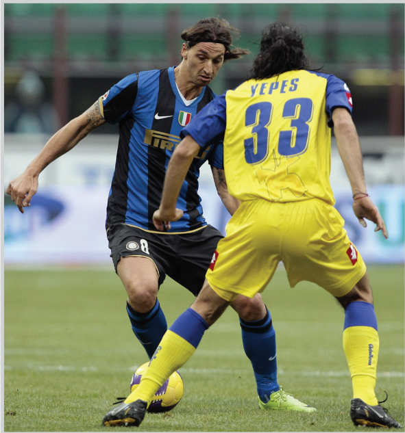
ابراهيموفتش يعزز مسيرة إنتر ميلان في الدوري

خاوندي راموس مسؤولية تدريبه قبل شهرين. واعتمد ريال مدريد خلال المباراة على الهجمات المرتدة، وتآلق غونزالو هيوغو الذي سجل هدف المباراة الوحيد وأرين روبن وحارس المرمى إيكير كاسياس الذي تصدى لعدد من الكرات الخطيرة في الدقائق الأخيرة من المباراة. وقال كاسياس: الشيء الأهم هو أننا نواصل الانتصارات.. لم تكن مباراتنا الأفضل في الموسم الحالي ولكن شبابنا لم تتلق أهدافاً وواصلنا سلسلة الانتصارات. وجاء هدف المباراة الوحيد بعد خمس دقائق من بداية الشوط الثاني حيث تلقى هيوغو تمريرة من زميله المخضرم راؤول وراوغ المدافع سيزار نافاس قبل أن يسد الكرة إلى الشباك ليكون الهدف الثالث عشر له هذا الموسم. وكثف سانتاندر محاولاته لإدراك التعادل لكن لاعبيه افتقدوا المهارة في اللمسات الأخيرة أمام المرمى. وانزعج ليفربول صدارة الدوري