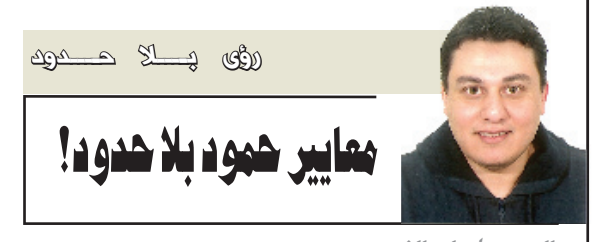
السويد / علي التميمي

بينما في الشوط الثاني عاد الميلان لمحاولاته وإصراره الدائم بتعديل النتيجة، ورغم الهدف الذي سجله الهولندي سيدورف الذي لم يحسب بسبب لمس الكرة بيده بشكل غير مقصود، حصل الميلان على ركلة جزاء في الدقيقة ٦٦ بعد تقدم من البرازيلي الشاب ألكسندر باتو وتدخل قوي عليه، نفذ ركلة الجزاء البرازيلي الآخر ريكاردو كاكسا وسجلها في شباك ريجينا. ومسع مرور الوقت والمحاولات وتحريض كاكسا لإصابة قد تكون طفيفة نوعاً ما أجبرته للخروج من الملعب، حتى دخل بعدها أنتونيوني وإزاعي قبله، لكن لم يستطع أي من الأسماء التي دخلت من الميلان في الشوط الثاني تغيير وسيطرة تامسة للميلان في الشوط الأول، استطاع الإيطالي الشاب دي جينارو تسجيل هدف صعب لصالح ريجينا بعد خطأ دفاعي لبنيهي الشوط الأول بتقدم ريجينا.