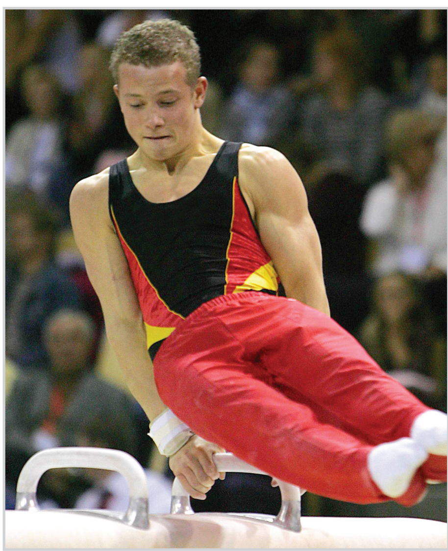
احدى فعاليات الجمناستك