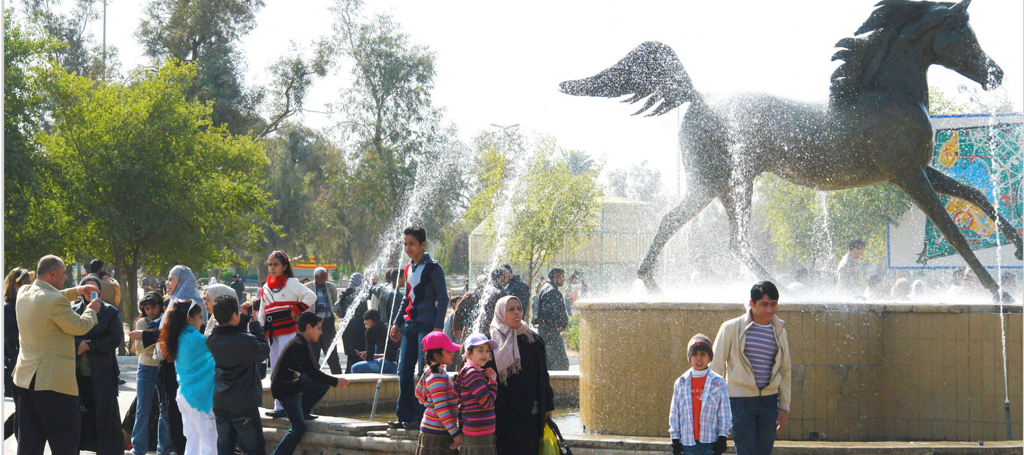
الامن وافراح الناس

اطفال ونفايات بدل ان يرحوا بين الزهور والحدائق صارت الزايل وجهة الاطفال في ضواحي العاصمة للبحث والتقطيع عن ما يمكن الاستفادة منه ابعدوا هذه النفايات بعيدا عن العاصمة بغداد.