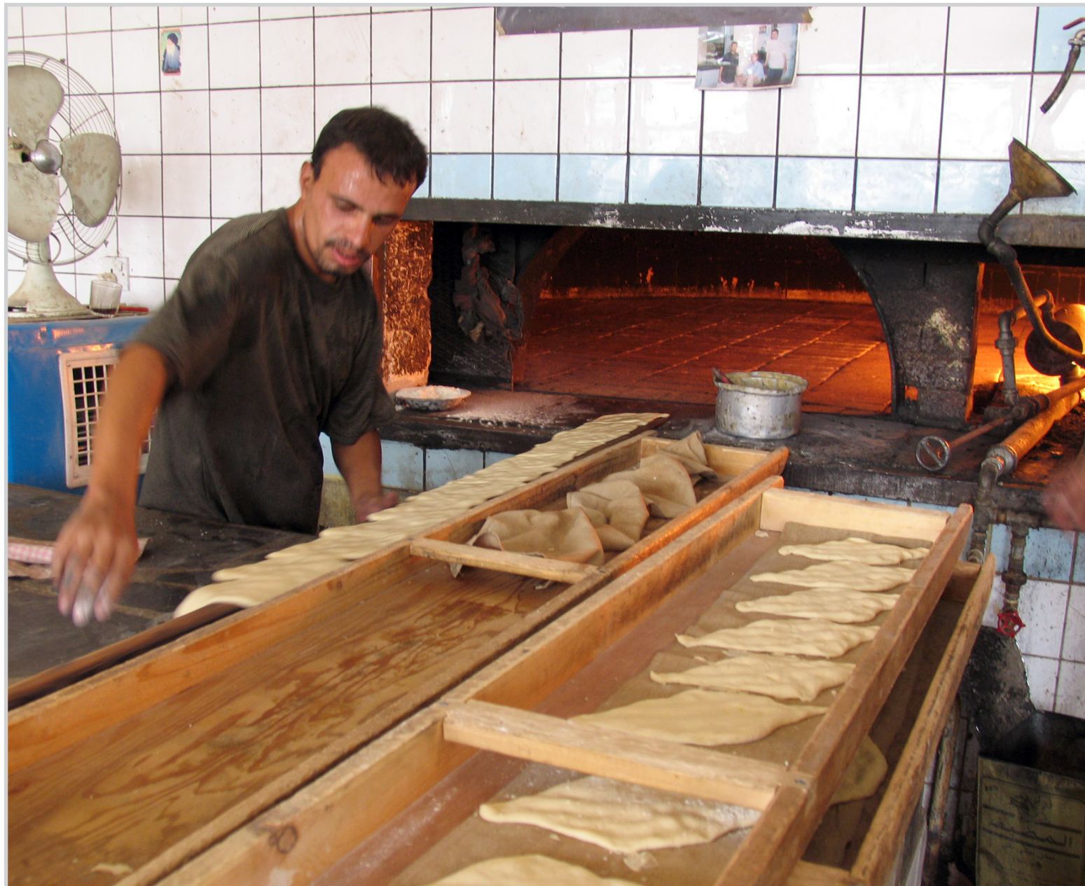
فرن حجري في بغداد