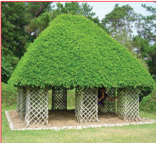
أشجار طبيعية لكنها نمت بهذه الأشكال الهندسية الرائعة من دون تدخل بشري..