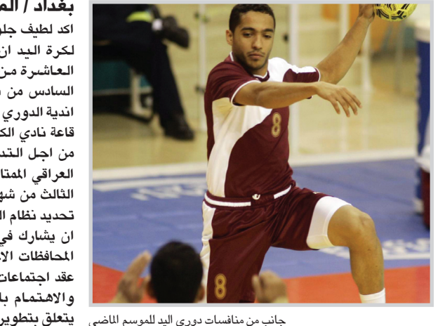
جانب من منافسات دوري اليد للموسم الماضي