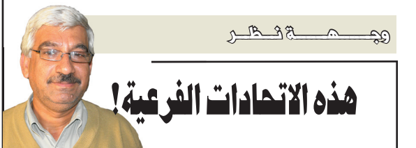
هذه الاتحادات الفرعية!