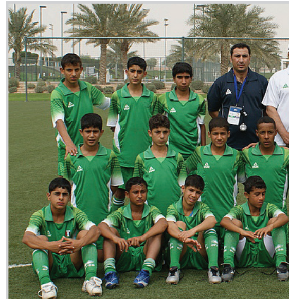
بداية جديدة لاشبال العراق في مشاراهم الآسيوي

النتائج في ترتيب مراكز الفرق المشاركة في المهرجان الذي أيضا لا يمتنع جوائز وكؤوس للفرق ال (١٢) المشاركة فيه، بل تمنح شهادات تقديرية مشاركة فقط. كما تشير مرة أخرى الى ان الالاحة تقضي بتقسيم اي منتخب مشارك الى فريقين يضم كل فريق (١١) لاعبا وكل تشكيلة تخوض مجموعة من المباريات. كما لا يستبعد منطوق المهرجان اي لاعب بسبب تجاوز العمر لكن رئيس قسم التطوير في الاتحاد الآسيوي الدكتور شامل كامل قال لنا: ان الملاحظات عن بعض اللاعبين الذين تتجاوز أعمارهم الحد المقرر ترفع الى الاتحاد الآسيوي ويصار لاحقا الى فحص هؤلاء اللاعبين عندما يصعدون الى منتخبات الناشئين في بلدانهم.