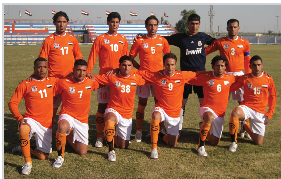
فريق الكهرياء يتعرض لنقد قاس من ادارته