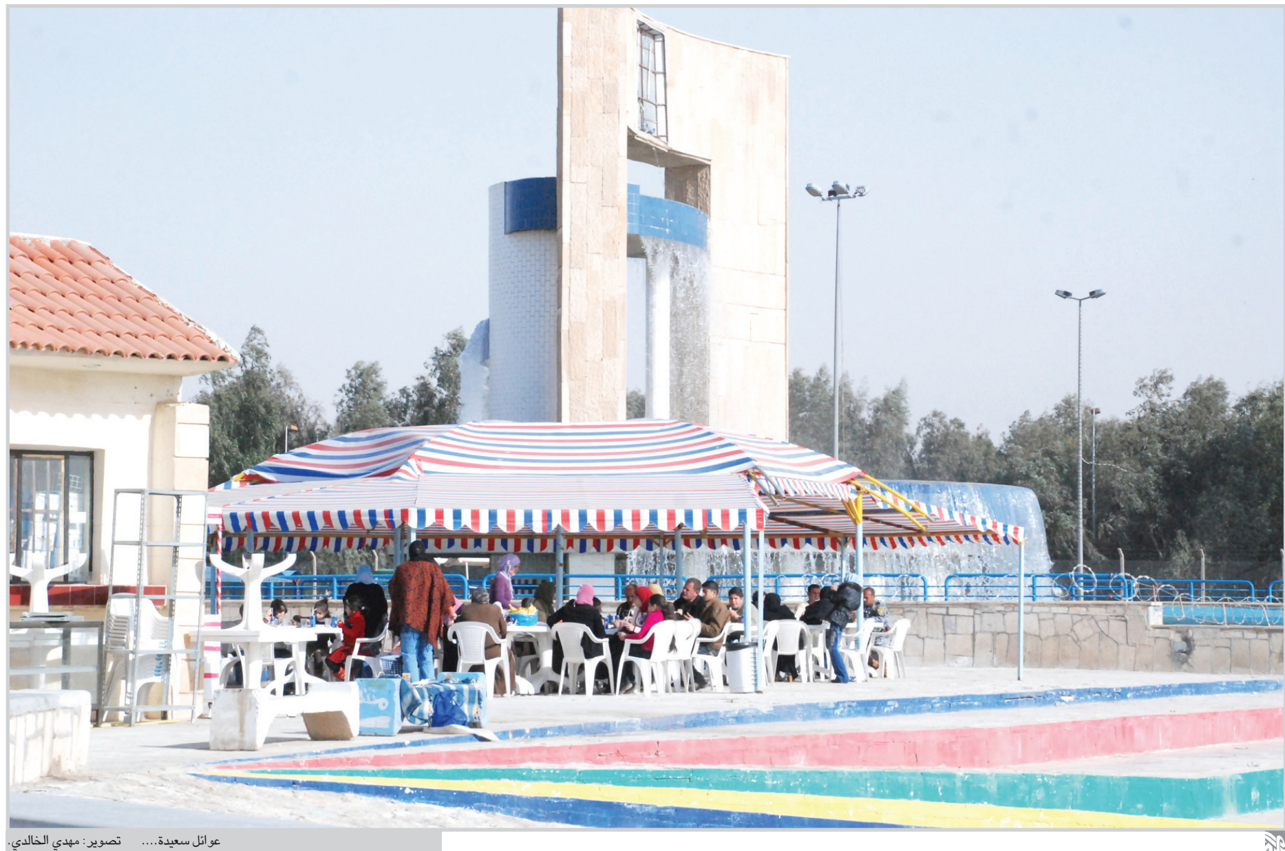
عوائل سعيدة....

تطوير أمكانية العاملين ولاسيما في مجال الإدارة وامكانيات الحكم الصالح وكفاءة الاداء، فضلا عن تكوين شبكة أساسية في العراق من المدراء الذين لديهم الرغبة والقدرة على اجراء اصلاحات في القطاع العام والتعرف على اهمية التخطيط الاستراتيجية في تحديد الاهداف المستقبلية والخطوات التي يجب أن تتخذ لتحقيق تلك الاهداف.