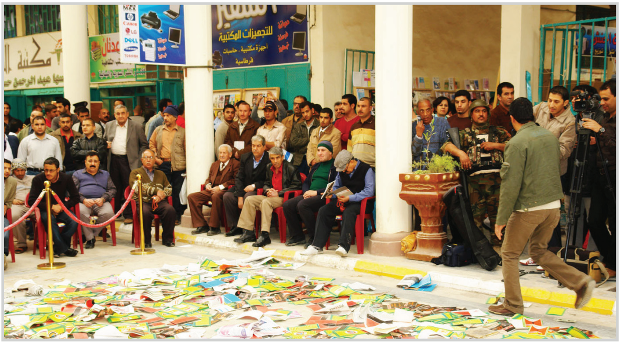
جانب من حضور فعاليات نهار اللى (شارع وحياة) في شارع النتنبي ...