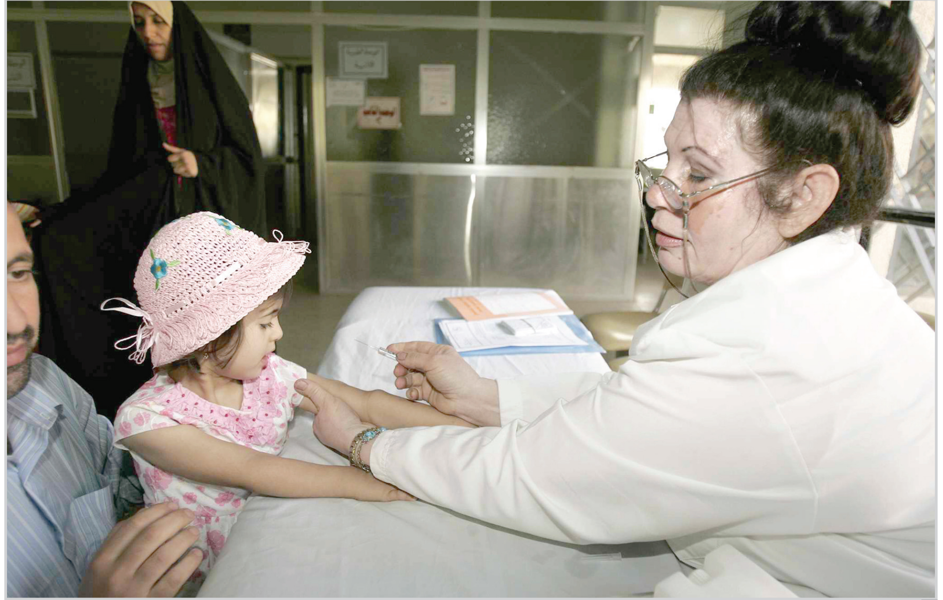
بدء حملة التلقيح ضد الحصبة...

بغداد/ حسين العامل قامت مؤسسة الشهداء في ذي قار بزيارات تفقدية لأسر الشهداء شملت 90 أسرة توزعت على مناطق الإهوار والوحدات الإدارية الأخرى وذلك للاطلاع على الأوضاع الاقتصادية والاجتماعية لآلوي الشهداء، وأوضح مدير مؤسسة شهداء ذي قار