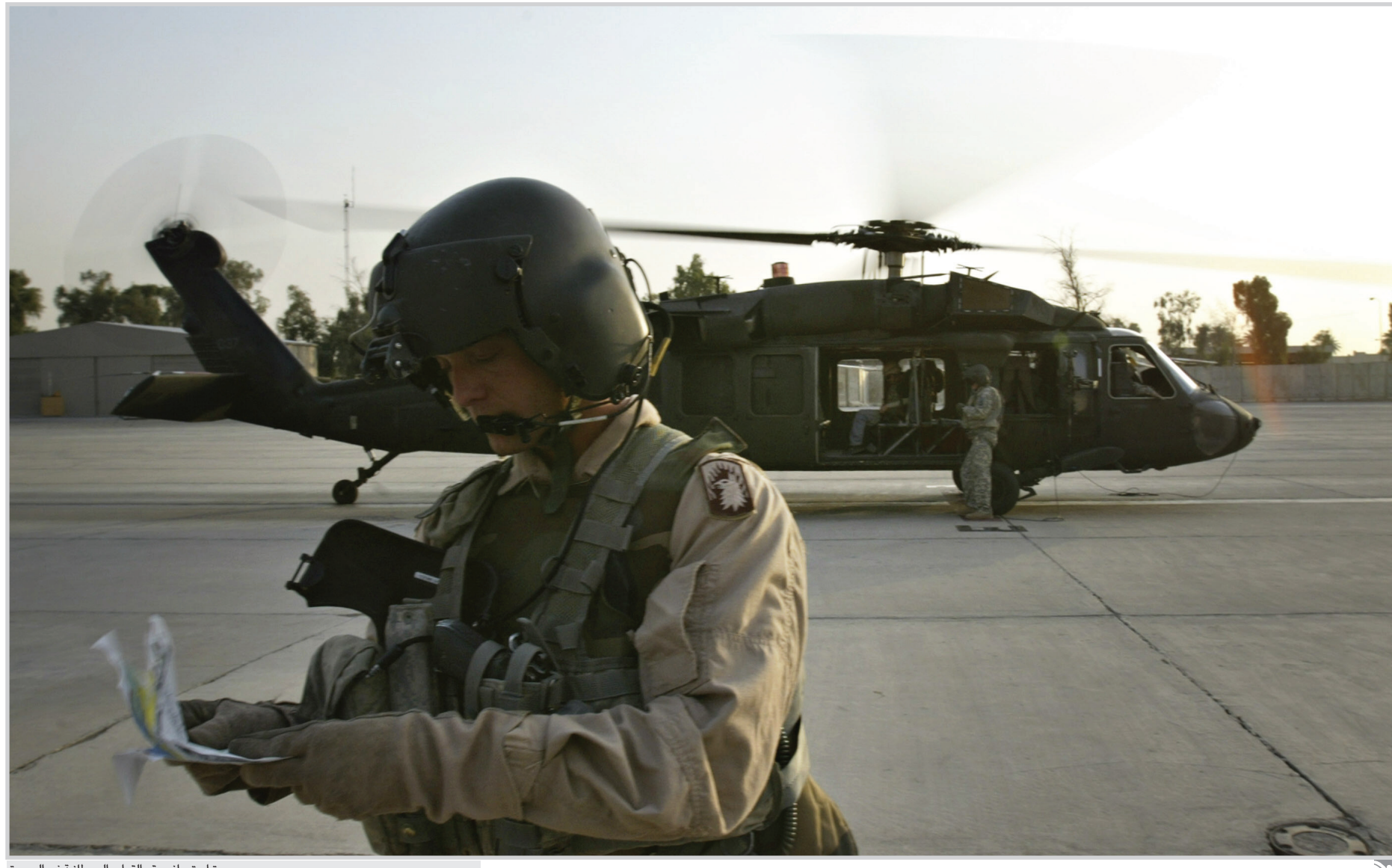
عودة استهداف مقر القوات البريطانية في البصرة