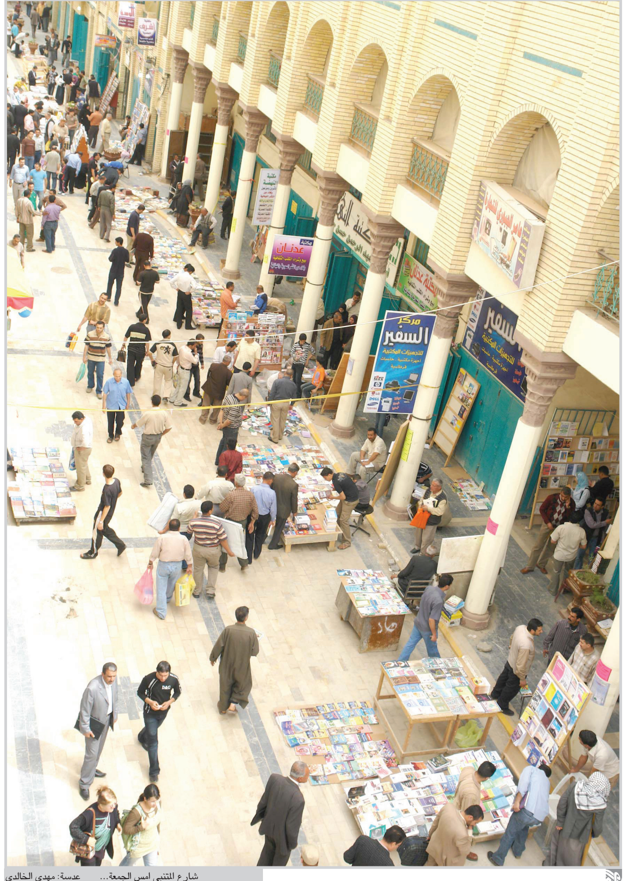
شارع المتنبي امس الجمعة...