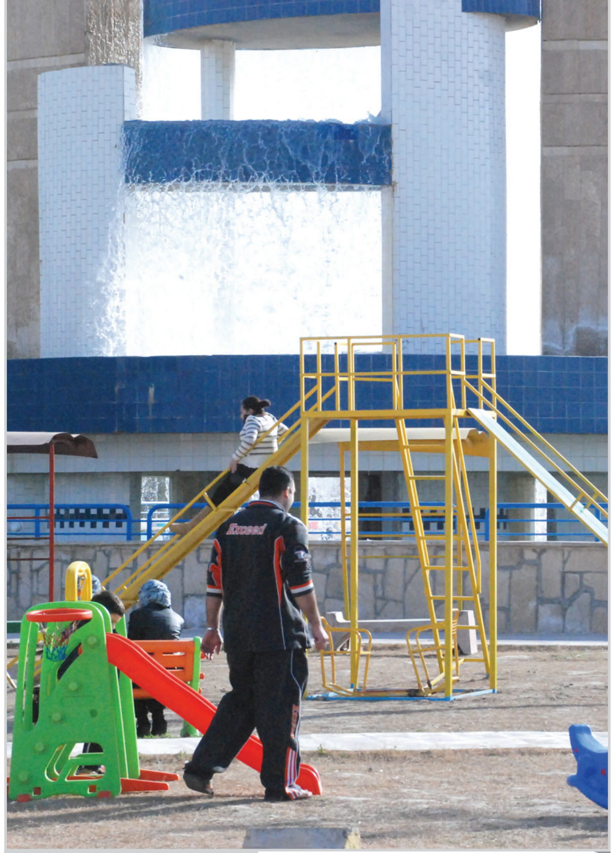
متنزه للاطفال في بحيرة الجادرية...