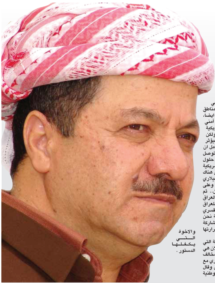
والاخوة النسي يكفها الدستور.