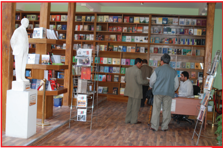
ثلاث لقطات من فعالية يوم أمس