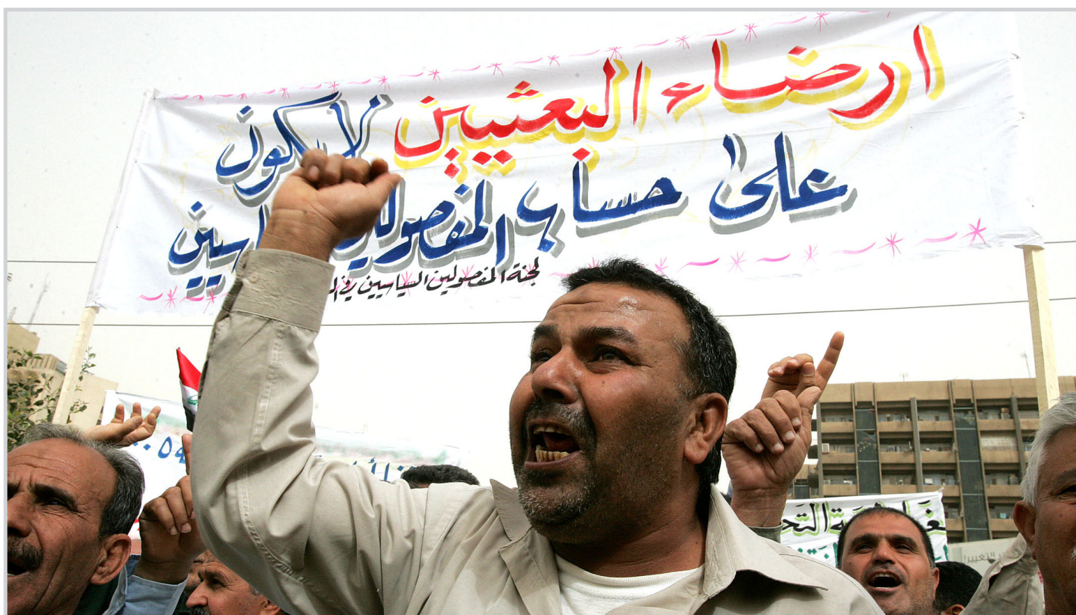
محتجون يتظاهرون ضد الفارضات مع البعثيين .. الخ.ب.

توقع مصدر مسؤول في الهيئة العامة للأنواء الجوية والرصد الزلزالي في وزارة النقل ان حالة الطقس ليوم غد الأحد ٢٩ / ٣ / ٢٠٠٩ للمناطق كافة: طقس غائم جزئي وأحياناً غائم في الاقسام الشرقية مع فرصة لتساقط زخات مطر وحدوث عواصف رعدية ثم يتحسن تدريجياً مع درجات حرارة اقل مما سجل يوم امس وذلك لانخفاض المنخفض الجوي المشار اليه اعلاه نحو الشرق نتيجة لتقدم امتداد المرتفع الجوي القادم من شرق البحر المتوسط والذي ترافقه كتلة هوائية باردة وجافة نسبياً ، الرياح متغيرة الاتجاه خفيفة السرعة(٥-١٠)كم/س تتحول الى شمالية غربية خفيفة السرعة(١٠-٢٠) كم/س ، مدى الرؤية (٢-٨) كم وفي المطر(٤-٦) كم وتوقع المصدر أن درجة الحرارة الصغرى المتوقعة في مدينة بغداد (١٢) °م. في حين ستكون درجة الحرارة العظمى المتوقعة في مدينة بغداد (٢٥) °م.