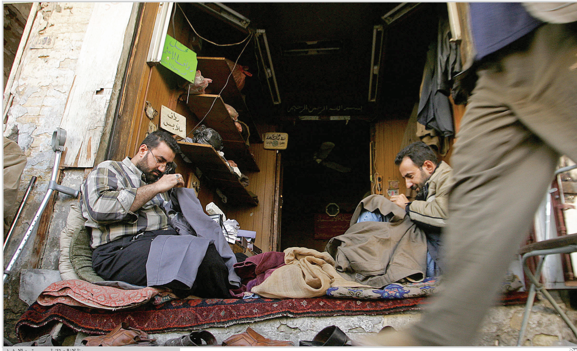
مهنة لآ زالت قائمة.. صورة من الأرشيف