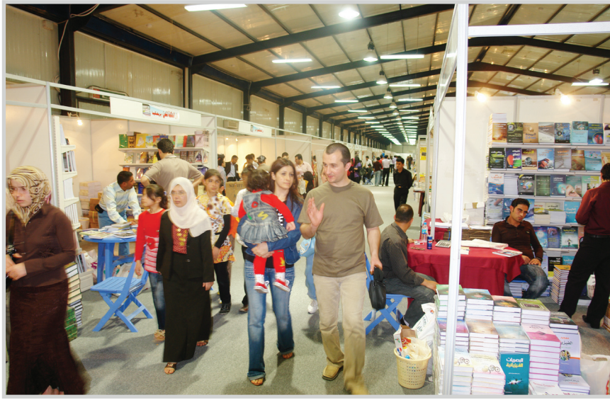
العوائل ايضا في ضيافة المعرض