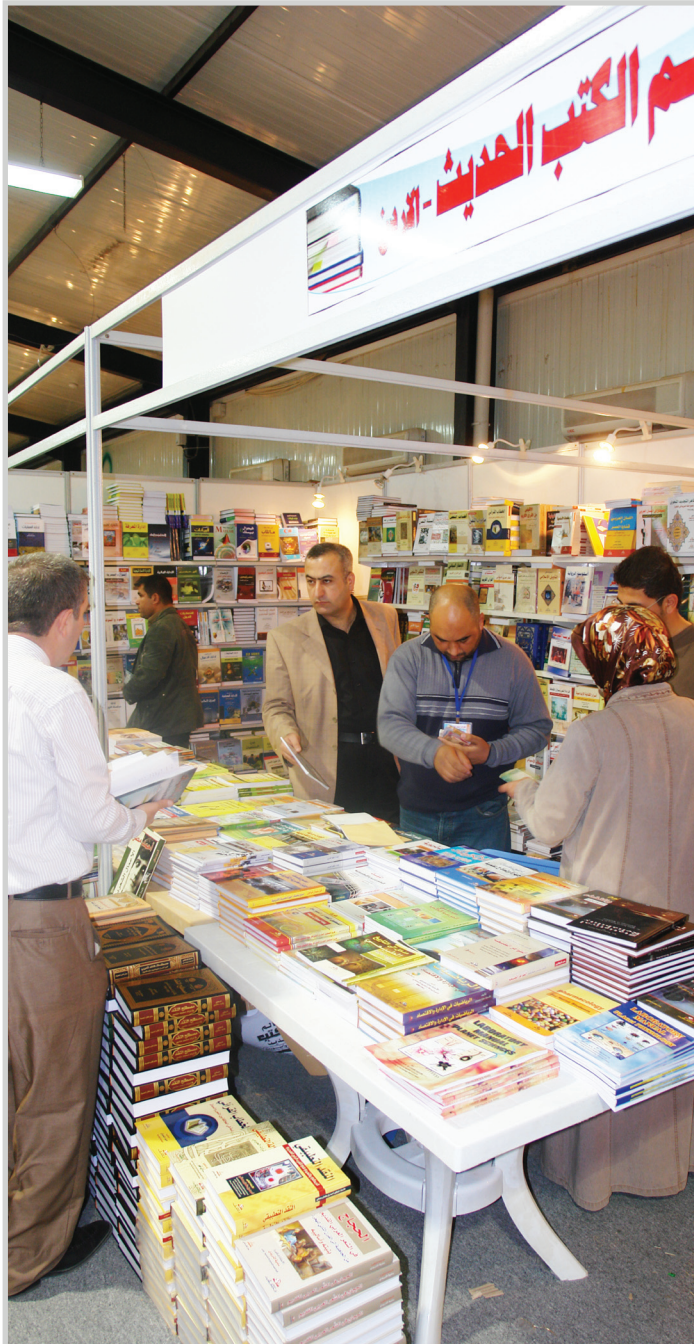
كتب تتناول كل الموضوعات