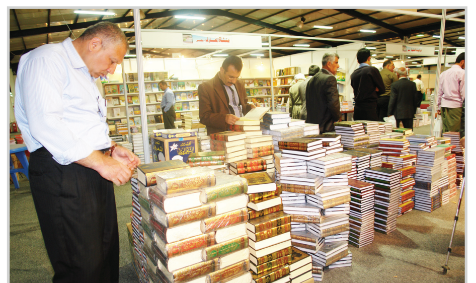
الموسوعات لها مكان متميز