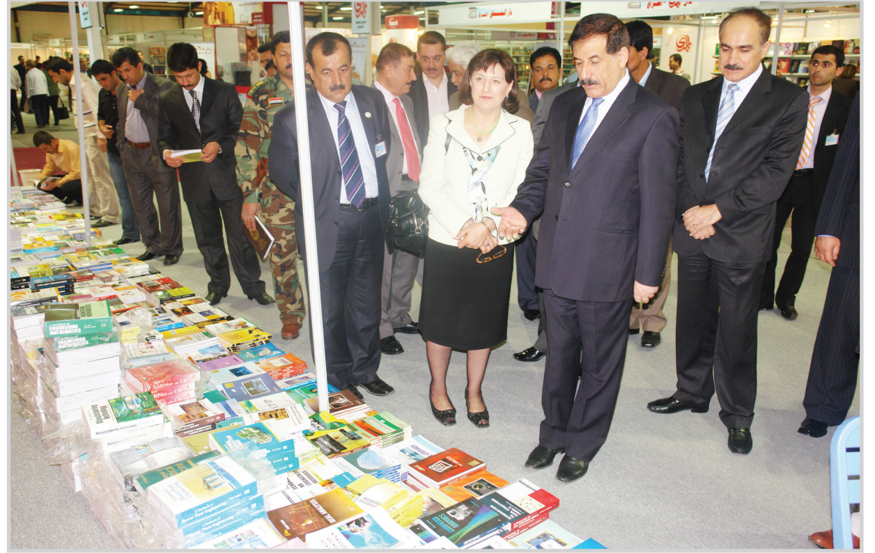
وزير التعليم العالي أثناء تجواله في المعرض