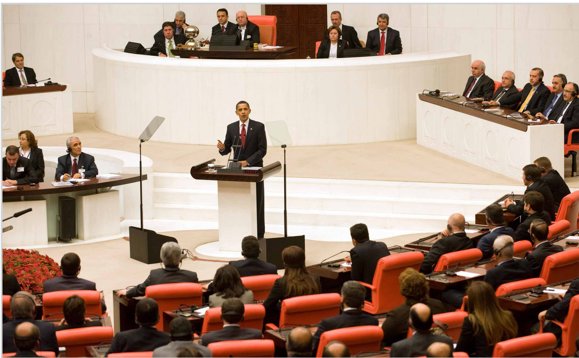
باراك اوباما يدافع مجددا عن انضمام تركيا الى الاتحاد الاوروبي .. (الغاب)