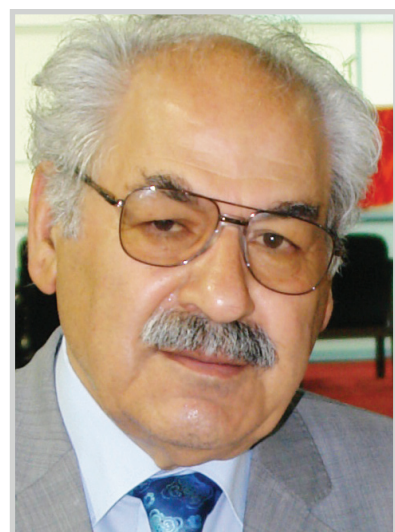
فلك الدين كانه بي

اطلقوا عليه لقب عميد الصحافة العراقية او