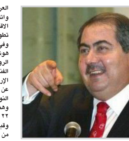
بغداد/ المدى رحبت مصادر روسية وعراقية بنتائج زيارة رئيس الوزراء نوري المالكي لروسيا. وقال الناطق الرسمي باسم الحكومة العراقية علي الدباغ إن زيارة الوفد

العراقي برئاسة رئيس الوزراء لموسكو كانت ناجحة. واتفق الجانبان الروسي والعراقي على تطوير التعاون الاقتصادي المشترك في مجال الكهرباء والنقط وعلى تطوير التعاون العسكري. وفي ما يخص التعاون العسكري قال وزير الخارجية هوشيار زيباري في تصريحات صحفية ان الجانب الروسي أعلن أخيرا موافقته على تفعيل التعاون العسكري الفتي، وإن طلب بغداد لتوريد مروحيات عسكرية لمكافحة الإرهاب وخفر الحدود لقي تفهم موسكو بعدما كانت تعبر عن شكوكها في إمكانية توريد معدات عسكرية من هذا النوع للعراق. وهناك معلومات تفيد أن العراق سيحصل من روسيا على ٢٢ طائرة مروحية من طراز «مي-١٧» في عام ٢٠١٠. وقبل ذلك يتم تفعيل التعاون العسكري الفتي بين البلدين من خلال تصليح المعدات والتقنيات العسكرية الروسية التي مازال العراق يملكها، وتوريد قطع غيار لها. وفي ما يخص التعاون الاقتصادي يعطي الجانب الروسي تأكيد صلاحية بعض العقود التي وقعتها شركات نفطية روسية وخاصة شركة «لوك اويل» مع الحكومة العراقية السابقة اولوية قصوى.