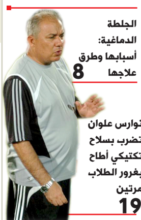
نوارس علوان تضرب سلاح تكتيكي أطاح بفرور الطلاب مرتين 19