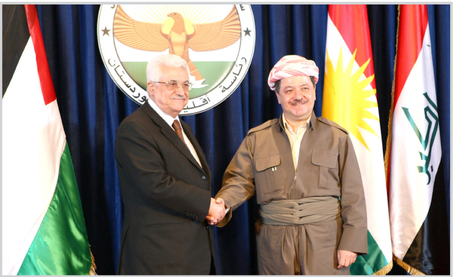
بارازاني يستقبل محمود عباس ومن المقرر ان يعقد الرئيسان مؤتمراً صحفياً يسليطان فيه الضوء على اهم ماتمت مناقشته خلال الاجتماع.

بغداد/ المدى وصل رئيس السلطة الفلسطينية محمود عباس والوفد المرافق له الى مدينة أربيل بعد ظهر امس الاثنين ، في زيارة مفاجئة لم يعلم عنها مسبقا. واستقبل رئيس السلطة الفلسطينية في مطار أربيل من قبل مسعود بارازاني رئيس اقليم كردستان وعماد احمد نائب رئيس حكومة اقليم كردستان وعدد من الوزراء في حكومة اقليم كردستان. وبعد ذلك قتش الرئيسان مسعود بارازاني ومحمود عباس والشرف وعزف الشنيدان العراقي والفلسطيني وشنيد (اي رقيب) القومي. وعقب استراحة قصيرة عقد الرئيسان مسعود بارازاني ومحمود عباس اجتماعا بحضور نيجيرفان بارازاني رئيس حكومة اقليم كردستان وعماد احمد نائب رئيس حكومة اقليم كردستان وعدنان المغني رئيس