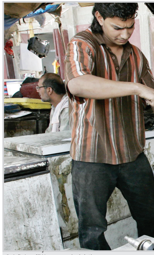
الولدات أصبحت بدلا للكهرباء الغائبة