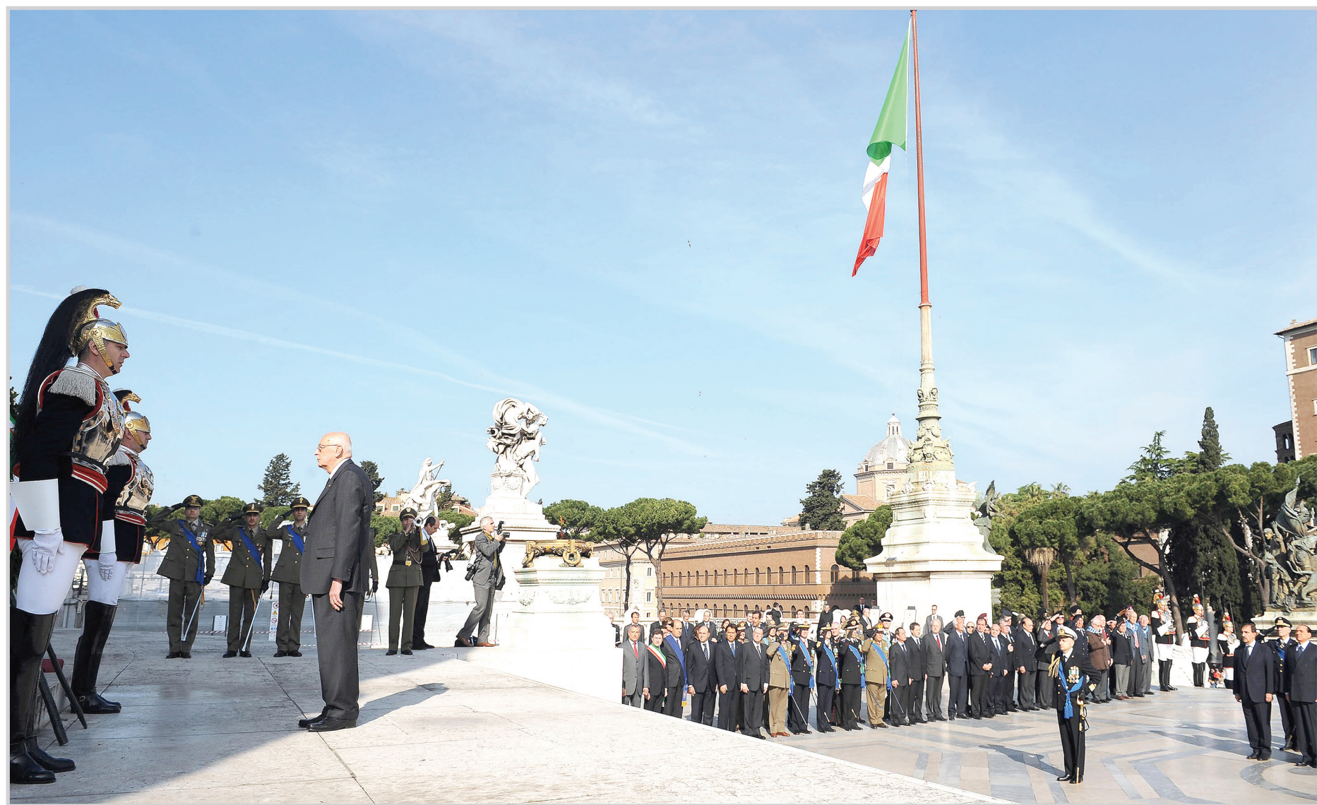
الرئيس الإيطالي ورئيس الوزراء بيرلسكوني يُعبران عن احترامهما لُنُصُب الجندي المجهول في روما، أثناء احتفالات الذكرى الرابعة والستين للتحرير