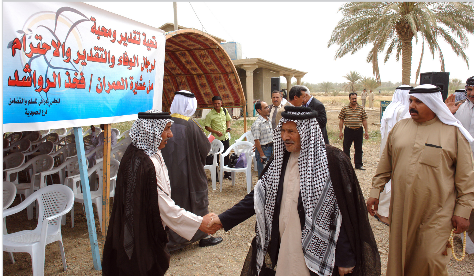
جانب من نشاطات المجلس العراقي للسلام والتضامن فرع الحمودية..