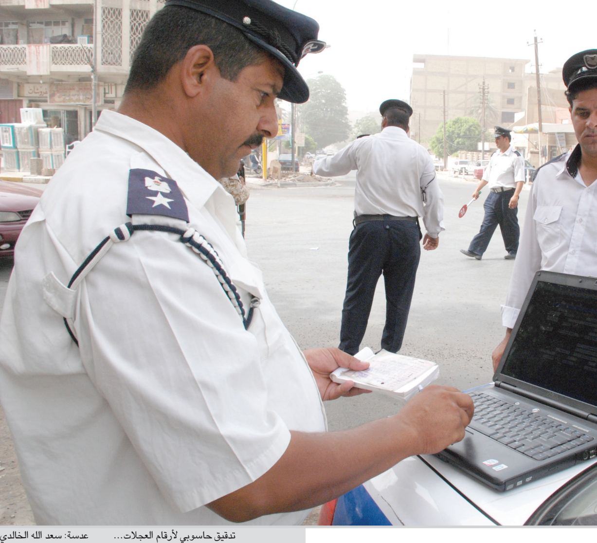
تدقيق حاسوبي لأرقام الجلاات...

بسبب تعدد القوائن التي تعمل بها الدوائر الحكومية وقدمها وعدم وجود قانون واضح يحدد الية عملها وان هناك اكثر من فراغ تشريعي في اكثر من مجال مطالبا بزيادة التنسيق بين الحكومات المحلية والحكومة المركزية. وأضاف ان كتابا من وزارة التخطيط الزم المحافظة بعدم اعلان مشاريع جديدة لعام ٢٠٠٩ لكون محافظة بابل مدينة للمقاولين والشركات عن الاعوام الثلاثة الماضية وان ميزانية المحافظة لهذا العام لا تكفي لسد