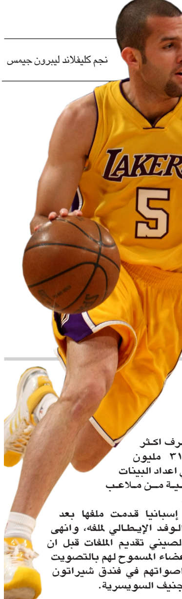
نجم كليفلاند ليربون جيمس

وكان أورلاندو أسقط كليفلاند على أرضه 107 - 106 في المباراة الأولى الأربعاء الأولى برغم تسجيل جيمس فيها 49 نقطة (رقم قياسي في مسيرته وفي تاريخ كليفلاند). التقى الفريقان مجددا أمس الأحد على ملعب أورلاندو حيث فاز الأخير على منافسه مرتين هذا الموسم اخرها بفارق كبير بلغ 29 نقطة في الثالث من نيسان الماضي. وكان أورلاندو في طريقه الى تحقيق الفوز الثاني وقطع خطوة كبيرة نحو التأهل إلى نهائي دوري المحترفين ، لكن جيمس كان له رأي آخر حيث تعلق على طريقة الاستورة مايكل جوردان وارسل كرة من مسافة بعيدة عن القوس مسجلا ثلاث نقاط ثمينة في الثانية الاخيرة. فامام أكثر من عشرين ألف متفرج ، بدأ كليفلاند الذي قدم اروع العروض هذا الموسم حتى الان ضاغطا لتسجيل فارق مريح وادراك التعادل ، فانهى الربع الاول بفارق 14 نقطة 30/16 ، لكن أورلاندو انتزع المبادرة بعد ذلك وحسم الارباع الثالثة الاخرى لصالحه 28 - 26 و 26 - 19 و 21/26 فبقي متأخرا ببضعة واحدة عن منافسه في نهاية المباراة.