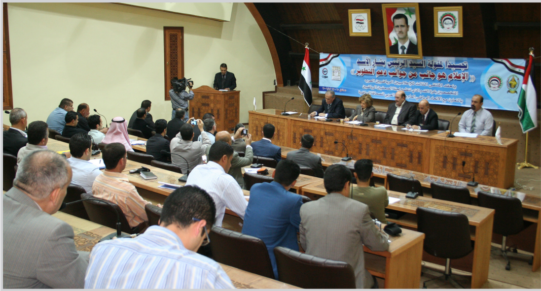
جانب من ملتقى الإعلاميين الرياضيين العرب في دمشق

والأفلام وأجابت لجنة الحكام مؤكداً ان الإعلام الرياضي يجب ان لا يكتفي بالمدح للحكام ولجانهم وطلب ان تكون المسألة الإعلامية الموضوعية للحكام الذين يتخذون قرارات خاطئة، والابتعاد عن الإثارة والتجريح والاتهام المسبق من قبل الإعلام الرياضي لعدد من الحكام . وعرض بوظو مجموعة من الأفلام الخاصة بالتحكيم وبعض فقرات ومواد التحكيم التي تثير الجدل بين الحكام والإعلام الرياضي والتي من الممكن ان تسهم في نجاح عملية التواصل بين الإعلام الرياضي والتحكيم ، مؤكداً أهمية الحوار بين لجان التحكيم والإعلام الرياضي من أجل إنجاح المنافسات الرياضية وابتعادها عن السلبيات . وأشرت أسئلة واستفسارات الزملاء بخصوص دور الإعلام في إنجاح المنافسات الرياضية وتنقيف الصحفيين في مواد قانون كرة القدم والمسجلات التي قد تطرأ على القانون .