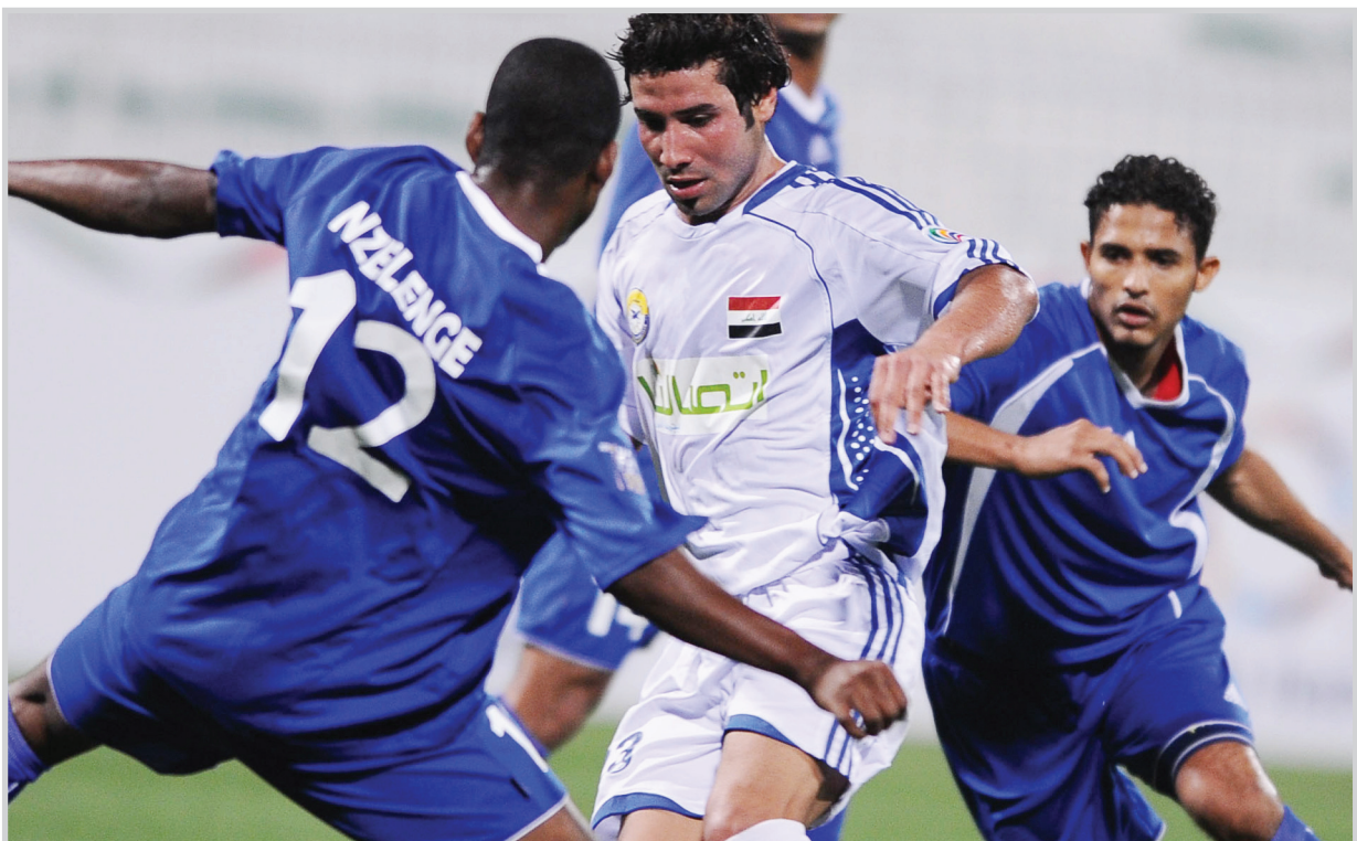
النورس تولاجه مهمة صعبة للانتقال الى الدور الثالث