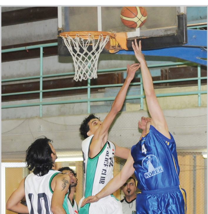
سلة دهوك تتفوق في قاعة حمزة نوري