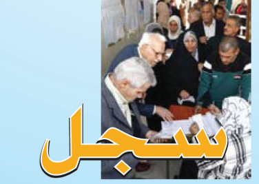
المفوضية العليا المستقلة للانتخابات ادارة انتخابات أقليم كوردستان كۆمىسيۆنىبالاىسەربەخۆىھەلېژاردنەكان The Independent High Electoral Commission www.ihec.ig

مكنك الاتصال على الهواتف الجانية اسيا سيل ٧٧٧٧ كورك ٢٠٢٠ للاستفسار عن عملية حّديث سجل الناخبين ووقتها واماكنها للناخبين او عبر الموقع الالكتروني للمفوضية www.ihec.iq