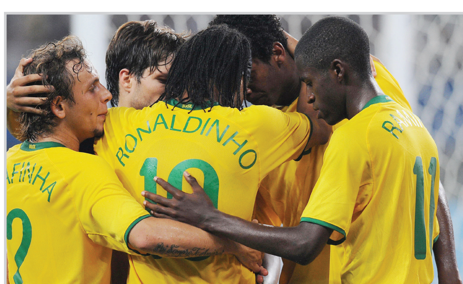
انتصارات متوالية للبرازيل

محقق. وتابع ميسي اهدار الفرص عندما تلاعب بالدفاع الاكوادوري وسدد كرة الى جوار القائم، وتحسن اداء المنتخب الاكوادوري في الشوط الثاني ونزل بكل ثقته على مرعى الارجنتين بيد ان الحارس ماريانو اندوخار تألق في الحفاظ على نظافة شبكته. وانفردت الاكوادور بالمركز الخامس برصيد ٢٠ نقطة مستغلة سقوط شريكها السابقة الاوروغواي في فخ التعادل امام ضيفتها فنزويلا ٢-٢. وتقدمت فنزويلا عبر كارنارو مالدونادو في الدقيقة التاسعة، وردت الاوروغواي بهدفين لوييس سواريز (٦٠) ودييغو فورلان (٧٣)، قبل ان يرك خوسيه مانويل راي التعادل لأصحاب الارض (٧٦). وعصفت كولومبيا جراح الجيرو صاحبة المركز الاخير وفازت عليها بهدف وحيد لراميل فالكاو غارسيا في الدقيقة ٢٥. وعززت كولومبيا حظوظها في احتلال المركز الخامس بعدما ارتقت الى المركز السابع برصيد ١٧ نقطة بفارق ٣ نقاط خلف الاكوادور علما بانها سيلتقيان في قمة ساخنة في بوغوتا في الجولة الخامسة عشرة من الخامس من ايلول المقبل.