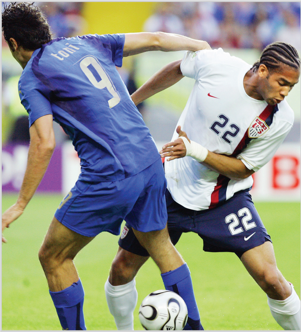
المنتخب الأميركي في مباراة سابقة

واشنطن / وكالات حجزت الولايات المتحدة مكانها في كأس القارات للمرة الرابعة بفضل تواجدها بلقب كأس الكونكاكاف الذهبية اثر فوزها على المكسيك في نهائي البطولة القارية التي اقيمت عام ٢٠٠٧.