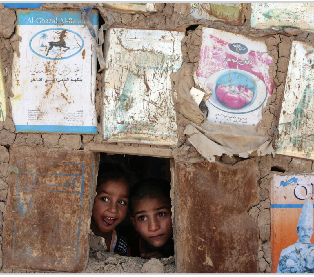
ترى الى ماذا ينظر هؤلاء الأطفال من (نافذة) دارهم ؟

الذي سيشارك في مراقبة انتخابات الاقليم كما تم الاتفاق على ارسال مديريين انتخابيين لتدريب موظفي المفوضية. وفي سياق متصل استقبل الجيدري القائم بأعمال بعثة جامعة الدول العربية الى العراق طارق عبد السلام بلطجي.. ورئيس بعثة الاتحاد الاوربي في العراق بانايوتس ماركس. يذكر ان امورا مهمة تمخضت عن لقاء رئيس مجلس المفوضين بالسفراء الثلاثة في أنهم اشادوا بإنجاز أعضاء في مفوضية الانتخابات التعاون المشترك على صعيدى التدريب والمراقبة والاستفادة من تجارب هذه الدول في المجال الانتخابي.