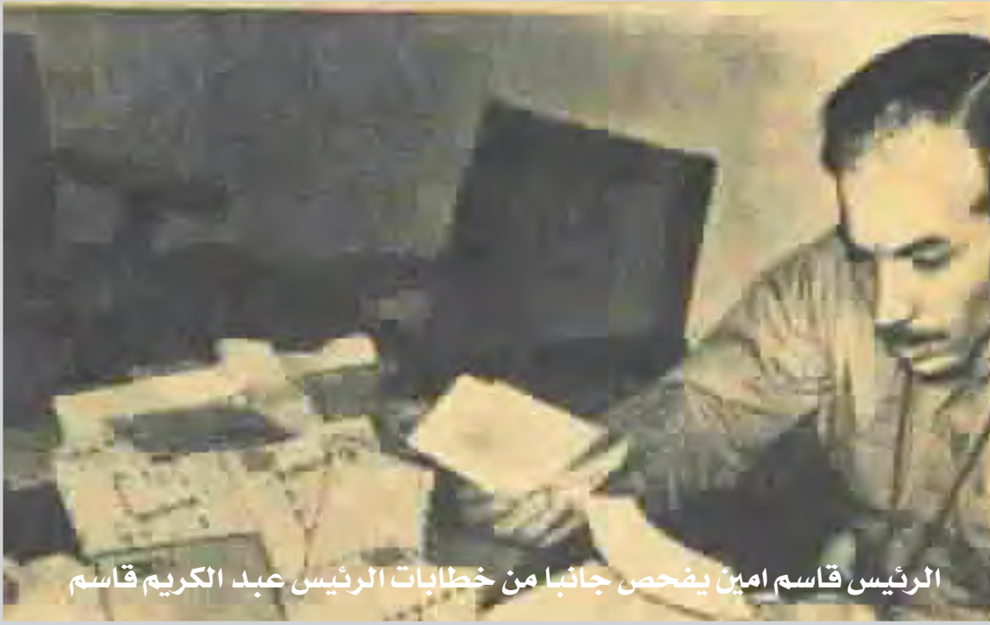
الرئيس قاسم امين يفتح جانباً من خطابات الرئيس عبد الكريم قاسم