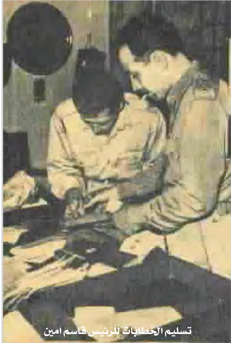
تسليم الخطابات للرئيس قاسم امين

وقد خصصت غرفة في وزارة الدفاع بها عدة دواليب للاحتفاظ بهذه الرسائل بعد ترتيبها وحفظها في ارشيف خاص..