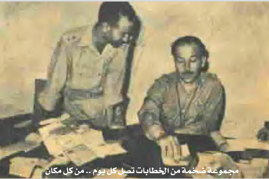
مجموعة ضخمة من الخطابات تصل كل يوم .. من كل مكان

لوحة من الجبس هدية ارسلت من فتاة عراقية من لندن وكتب عليها (الله يحفظك يا كريم)