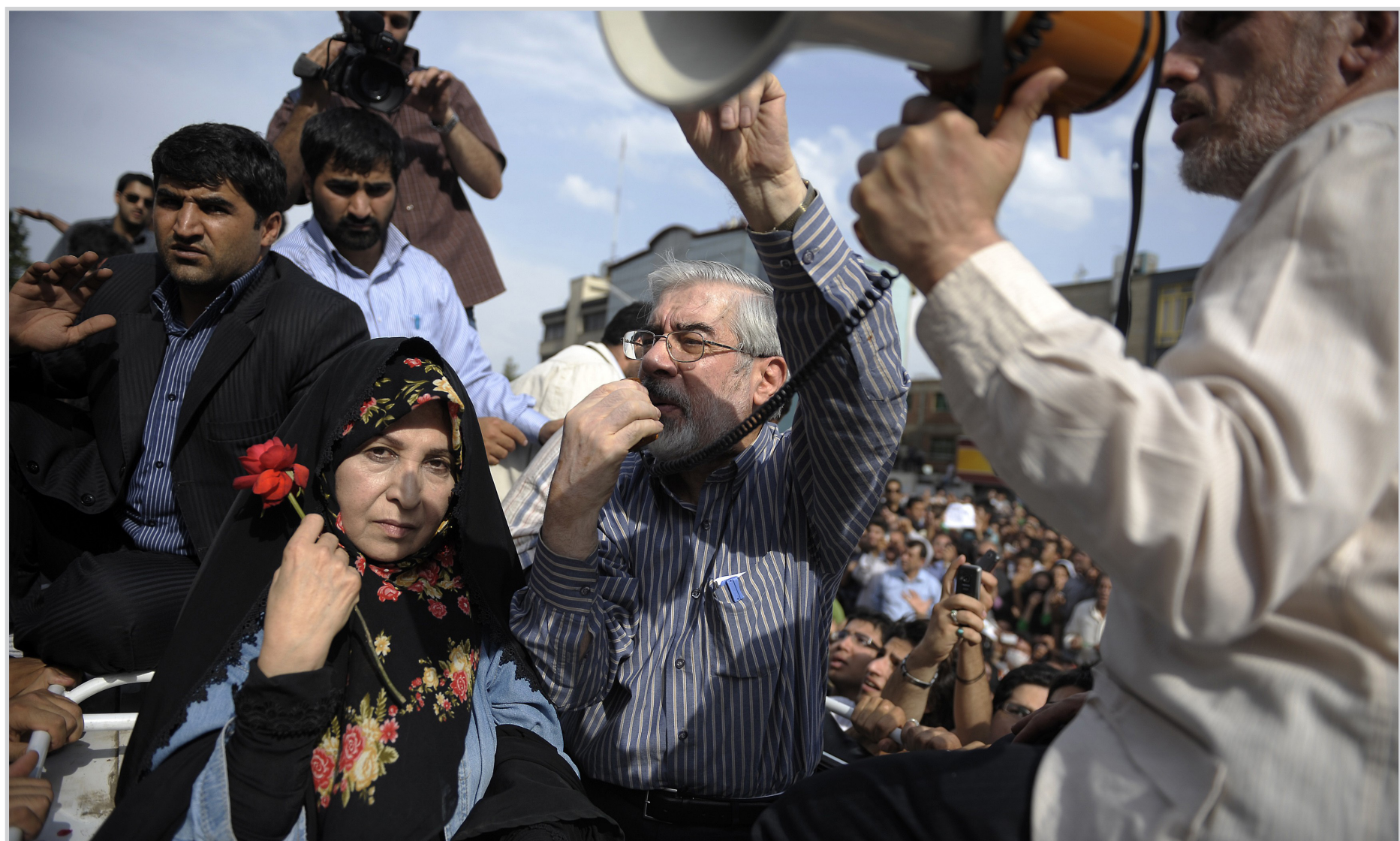
موسوي يقود التظاهرات برغم المنع ..

سيدني / الوكالات طالب رئيس الوزراء الأسترالي كين رود أمس الأحد زعيم المعارضة مالكوم تيرنبول بالاستقالة اذا فشل في تقديم رسالة بالبريد الإلكتروني تتعلق بمزاعم بان رود ضلل البرلمان. وتتعلق الرسالة باتهامات تفيد بان رود طلب معاملة حكومية خاصة لصديق في اطار برنامج مساعدة الشركات المتعثرة على ايجاد تمويل خلال الازمة المالية العالمية. وكانت المعارضة طالبت كلا من رود ووزير الخزانة وين سوان بالاستقالة بسبب القضية. وهناك مزاعم بان هذه الرسالة الالكترونية خرجت من مكتب رود لكن الحكومة تقول انها اخفقت في العثور على الوثيقة على أجهزة الكمبيوتر الخاصة بها واستدعت الشرطة للتحقيق يوم السبت. وسبق ان نفى تيرنبول انه لديه نسخة من الرسالة. نشأ الخلاف من الصداقة التي تربط بين رود وموزع سيارات