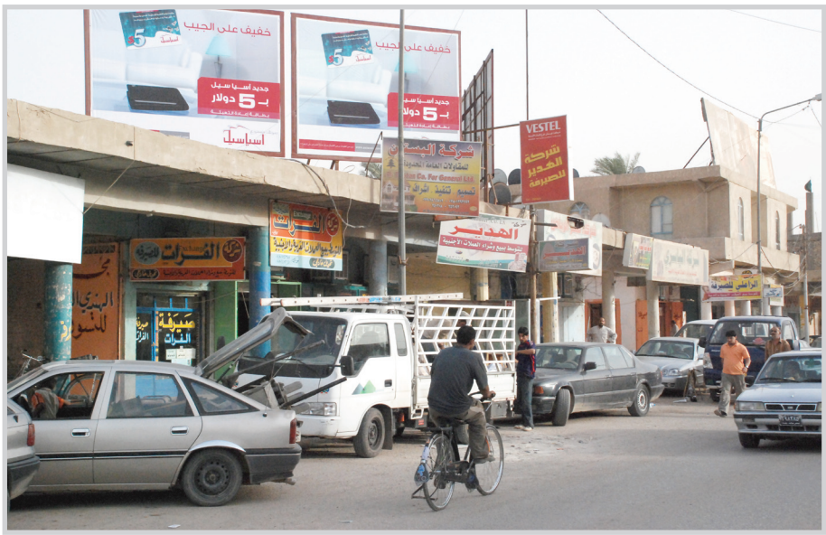
شارع في الحلة