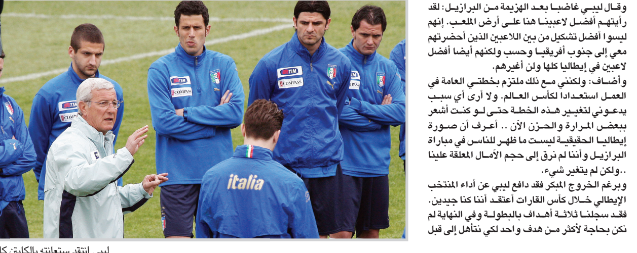
ليبي انتقد سعته الكابتن كانافارو

وذهب بعض المحللين الرياضيين في إيطاليا للربط بين العروض الضعيفة لمنتخب بلاده في كأس القارات وبين تدهور حال الدوري الإيطالي نفسه، وكتب فابريزيو بوكا في صحيفة لا ريبوبليكا يقول: إن المنتخب الوطني يعكس على أفضل نحو حال الكرة الإيطالية التي تمر بأزمة ليست اقتصادية وحسب ولكنها أيضاً تنظيمية وتمس حتى درجة وجودها. ويبدو أن المحللين الرياضيين وجدوا صلة بين إخفاق المنتخب الإيطالي في كأس القارات وبين إخفاق الأندية الإيطالية من ناحية أخرى على مستوى النهائي.