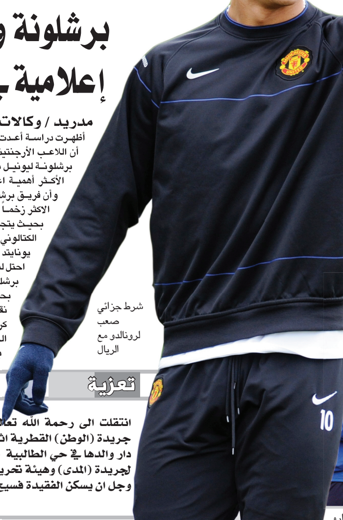
شرط جزائي صعب لرونالدو مع الريال

مدريد / وكالات وضع نادي ريال مدريد وفقاً لما نشرته صحيفة الماركا الأسبانية شرط جزائي في عقد لاعبه الجديد كريستيانو رونالدو يصل إلى ١,٠٠٠,٠٠٠,٠٠٠ يورو. وقد أوجعت الصحيفة سبب وضع ذلك المبلغ المرتفع في بنود فسخ عقد اللاعب مع فريقه الجديد إلى رغبة رئيس النادي فلورنتينو بيريز في ضمان وجود النجم البرتغالي خلال الستة مواسم القادمة والتي هي مدة عقد اللاعب مع الفريق. الصحيفة أشارت كذلك إلى أن فلورنتينو بيريز وضع هذا المبلغ من أجل سد الطريق عن رجال الأعمال الذين قدوموا عن طريق مانشستر سيتي، عرض الحصول على خدمات اللاعب البرتغالي في الموسم الماضي يصل إلى ١٦٨ مليون يورو. الجدير بالذكر أن كل من بوبول وراؤول وفان نيستروي هي أصحاب أعلى قيمة فسخ في عقودهم حيث يصل الشرط الجزائي في عقد كل منهم إلى ١٨٠ مليون يورو. لكن رونالدو بهذا الشرط الجزائي المرتفع سيتفوق عليهم بلا شك. كما علقت الصحيفة ساخرة من ذلك الرقم المرتفع عن طريق وصفه بأنه كافي لشراء ٦٦ لاعب وشراء طائرة من طراز إيرباص ١٠.