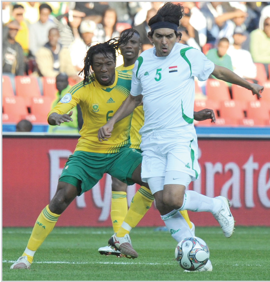
منتخبنا في افتتاح كأس القارات امام جنوب افريقيا

(٢١،٥٩م) في المبارتين التي لعبها امام جنوب افريقيا ونيوزيلندا . الزهرة المركز الثالث في ترتيب اللاعبين أكثرهم وقوعاً في مصيدة التسلل برصيد ثلاثة تسلات احتسبت عليه.