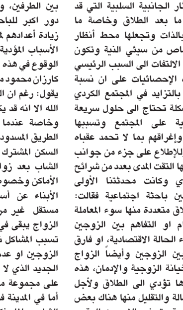
العنف احد اسباب الطلاق