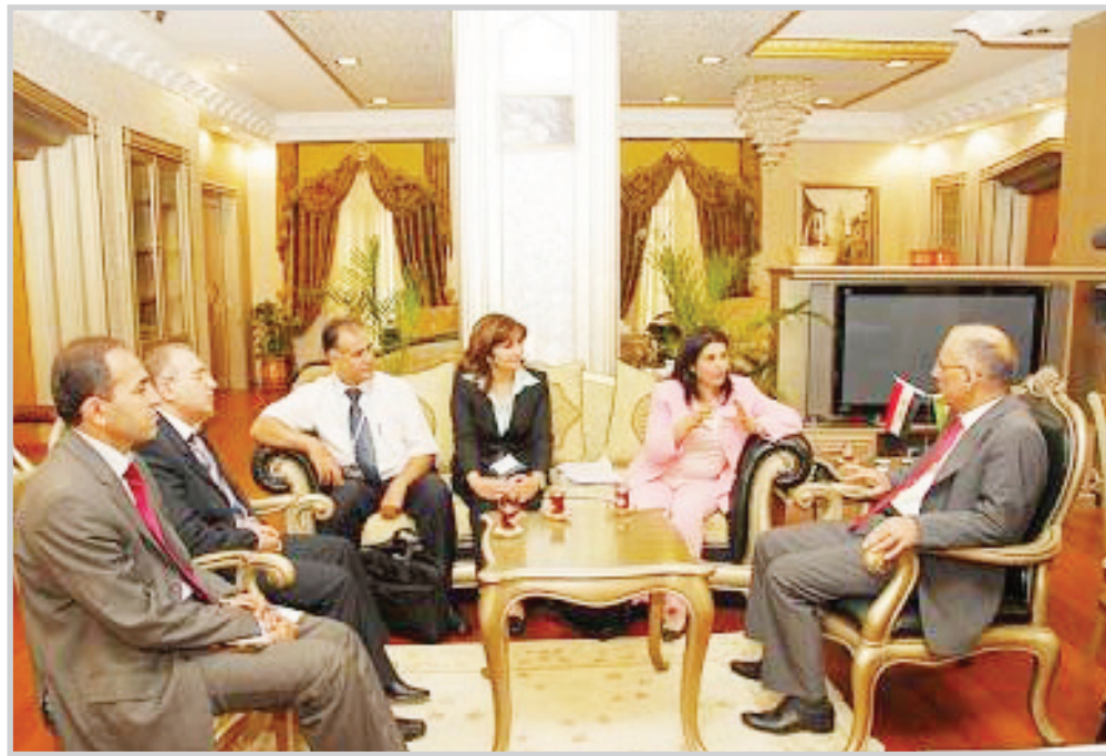
المتي يستقبل وفد منظمة الصحة العالمية

أربيل / المدى بحث عنان المفتي رئيس برلمان كردستان الخميس مع ممثل منظمة الصحة العالمية WHO نعيمة القصور والوفد المرافق لها الوضع الصحي في إقليم كردستان ومشاورات وبرامج منظمة الصحة العالمية ومنظمات الأمم المتحدة في مجال الصحة بالإقليم. وجرى في اللقاء بحسب موقع برلمان كردستان بحث خطط المنظمة لمواجهة مرض أنفلونزا الخنازير في العراق وإقليم كردستان على وجه التحديد، وقدمت نعيمة القصور بحثاً ملخصاً حول كيفية مواجهة المرض وتأمين المستلزمات وسبل توعية المواطنين عبر وسائل الإعلام، وشكرت وزارة الصحة في حكومة إقليم كردستان على تعاونها لإنجاح مهمة المنظمة. من جانبه، ثمن رئيس برلمان كردستان دور وتضحيات المناضلين في كرميان، وجرى عن دعمه لمطالبهم وتهدد بتأييد الموضوع مع حكومة إقليم كردستان لتلبية مطالبهم.