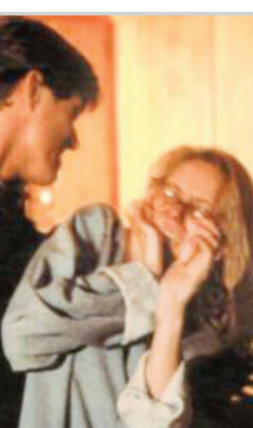
العنف احد اسباب الطلاق