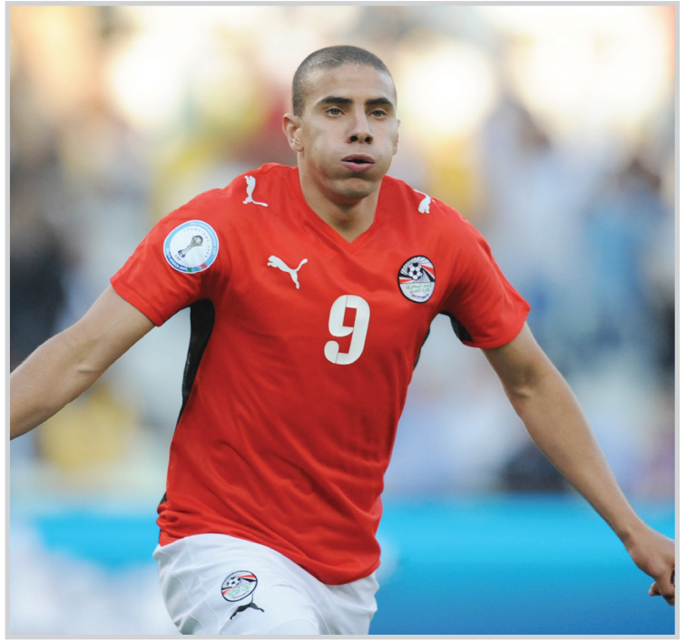
زيدان أمل الفراغة في مباراة رومانيا