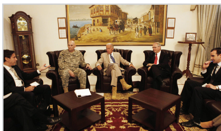
جانب من اللقاء.

روبرت غيثن ان بايدن سيعمل مع قائد القوات الاميركية في العراق الجنرال رى اوديرنو والسفير الاميركي كرسنوفر هيل على تنفيذ الاتفاقية الامنية بتطبيق الانسحاب الكامل من العراق، منوها الى ان الرئيس الاميركي اوكل لائبته الاشراف على السياسة العامة في العراق. وأشار غيثن الى ان بايدن سيعمل مع العراقيين باتجاه التقليل على الخلافات السياسية وتحقيق نوع من المصالحة مبينا ان فكرة تقسيم العراق الى مناطق طائفية او قومية مرفوضة بالنسبة للرئيس الاميركي باراك اوباما.