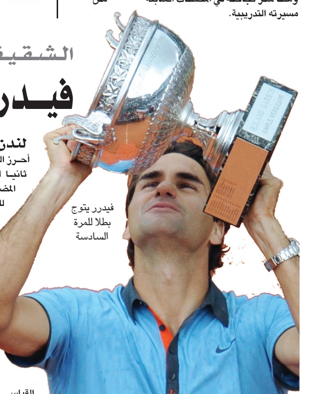
فيدرر يتوج بطلا للمرة السادسة