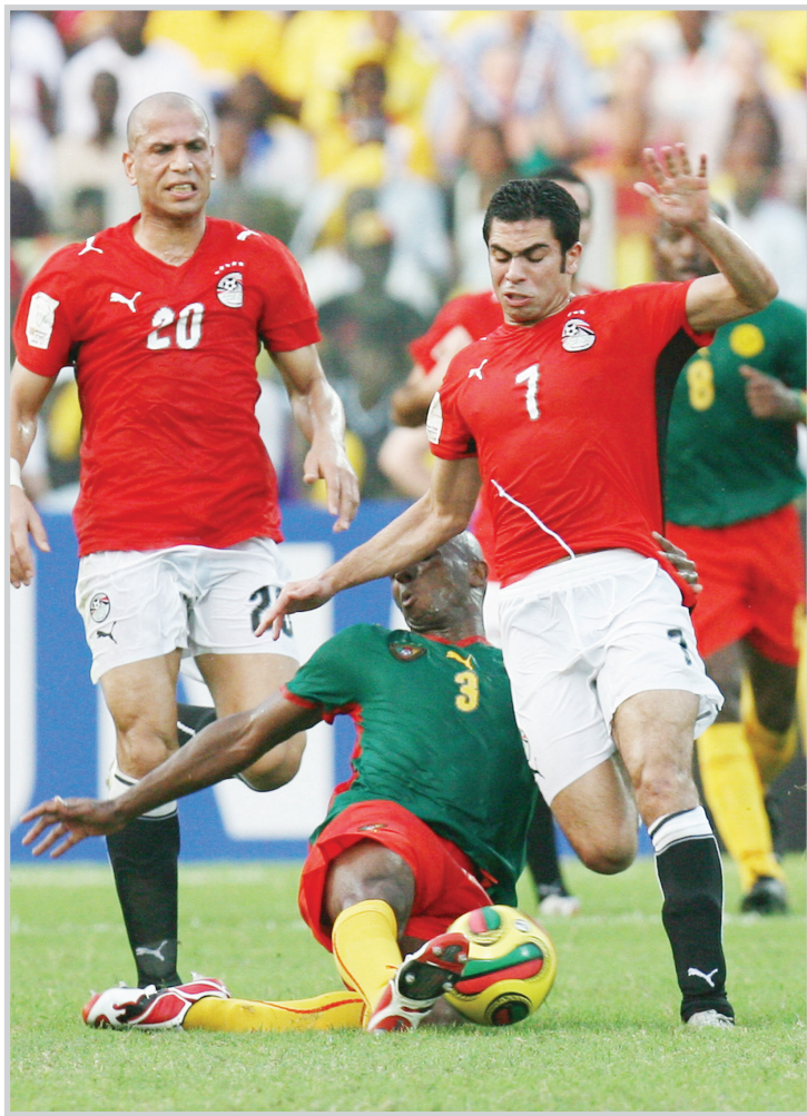
الفراعة يتألقون من جديد