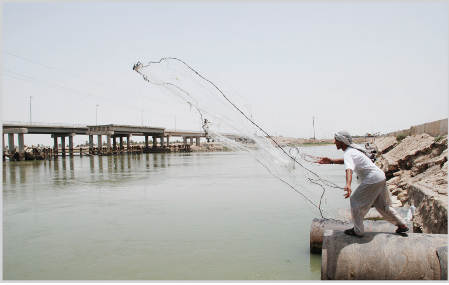
انخفاض مناسيب المياه

إن ذلك لم يستمر أكثر من أسبوع واحد. وطلب ذياب الحكومة التركية بإعلان خطتها التشغيلية لسودها، لكي يتسنى للعراق وضع خطة واضحة لمعالجة أزمة الجفاف. ودعا مدير المركز الوطني لإدارة الموارد المائية تركيا إلى الكشف عن مستويات الخزن أيضاً، لمعرفة طاقتها في تزويد العراق بالنسب المائية المطلوبة.