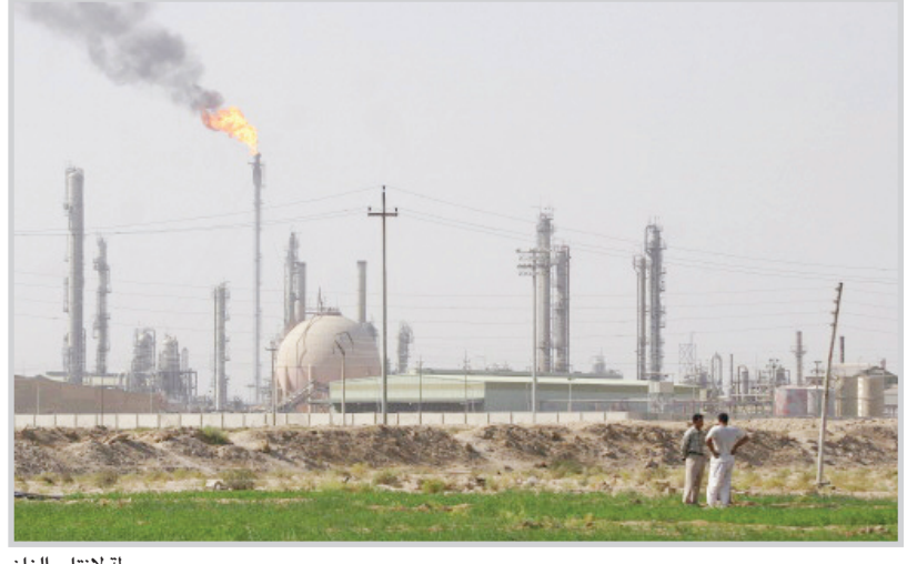
محطة لإنتاج الغاز

أكدت وزارة النفط أنها بصدد عقد اتفاق مع شركة شل ومسيو بيثي لتأسيس شركة عراقية - أجنبية تستثمر الغاز المصاحب الذي يحترق في جنوبي البلاد قريبا. وقال مصدر مسؤول لـ(المدى) ان الوزارة تدرس خطوات عمل للتوصل إلى اتفاق مع شركة شل ومسيو بيثي لتأسيس شركة عراقية - أجنبية تقوم باستثمار الغاز المصاحب في محافظة البصرة. وأضاف انه سيتم استثمار ما يقارب ٧٠٠ مليون قدم مكعب من الغاز كخطوة أولى. وأوضح المصدر ان هذه الكميات ستعكس على السوق المحلية من خلال توفير الغاز لمحطات الطاقة الكهربائية ومصانع البتروكيمياويات ومعامل الغاز. مشيراً الى ان الفائض منه سيصدر إلى الخارج. وتابع ان هذه الشركة سوف تعمل وفق القانون العراقي والشروط التي وضعتها وزارة النفط للاستثمار الامثل للغاز.