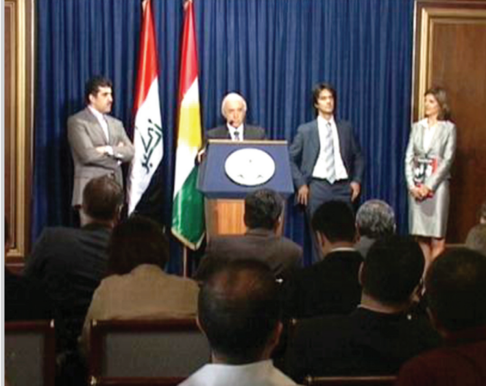
نيجيرفان بارزاني في مؤتمر صحفي

وأعلن في المؤتمر أن إقليم كردستان سيصبح بعد (١٠) سنوات القادمة أحد المناطق المهمة في العالم في مجال الإنتاج النفطي وقريباً سيصل إنتاج النفط فيه إلى مليون برميل يومياً. وأشار أشفي هورامي وزير الثروات الطبيعية في حكومة إقليم كردستان الى كيفية