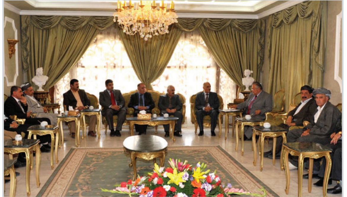
طالباني مع وفد البيشمركة

كما اجتمع طالباني مع علماء الدين وممثلي منظمات المجتمع المدني ومركز تنظيمات شارزور للاتحاد الوطني الكردستاني وقادة قوات البيشمركة في المنطقة، وتعهد بالعمل على تلبية مطالبهم المشروعة.