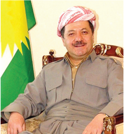
مسعود بارزاني ١٣