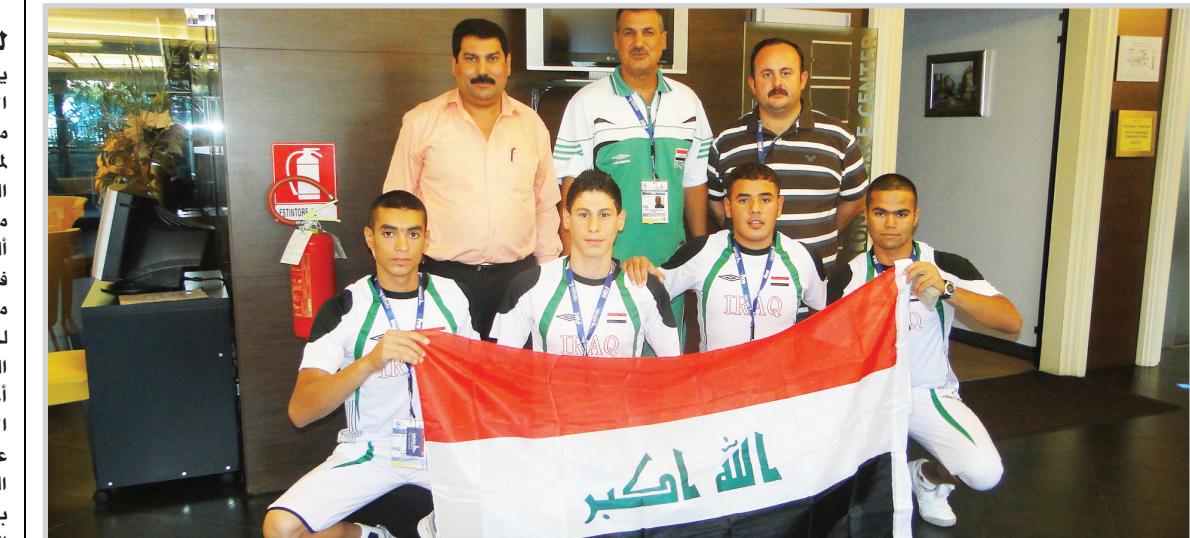
وقد منتخبنا المشارك بطولة العالم للالعاب المائية

وإبرزها تغيير رئيس الاتحاد الحالي العراقي الذي مضى على رئاسته ست دورات انتخابية ومن المؤمل فوز الأورغياني خوليو ماكويوني الأمين المالي الحالي برئاسة الاتحاد للدورة الانتخابية للسنوات الأربع القادمة. وقد باشر المؤمل ان تتواصل الاجتماعات خلال اليومين القادمين على ان تختتم بإجراء انتخابات الاتحاد الدولي للعبة حيث تشير مصادرنا بوجود تغييرات في المكتب التنفيذي للاتحاد