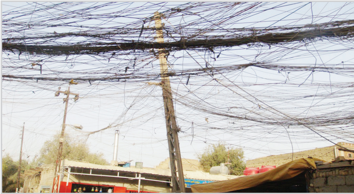
شبكة المولدات تتسلك اعمدة الكهرباء

لم تتم بسبب ان التيار يزداد سوءا بحيث في المدة السابقة يأتي ٦ ساعات في اليوم الواحد، اما الان ساعة في النهار واخرى في الليل في بعض المناطق