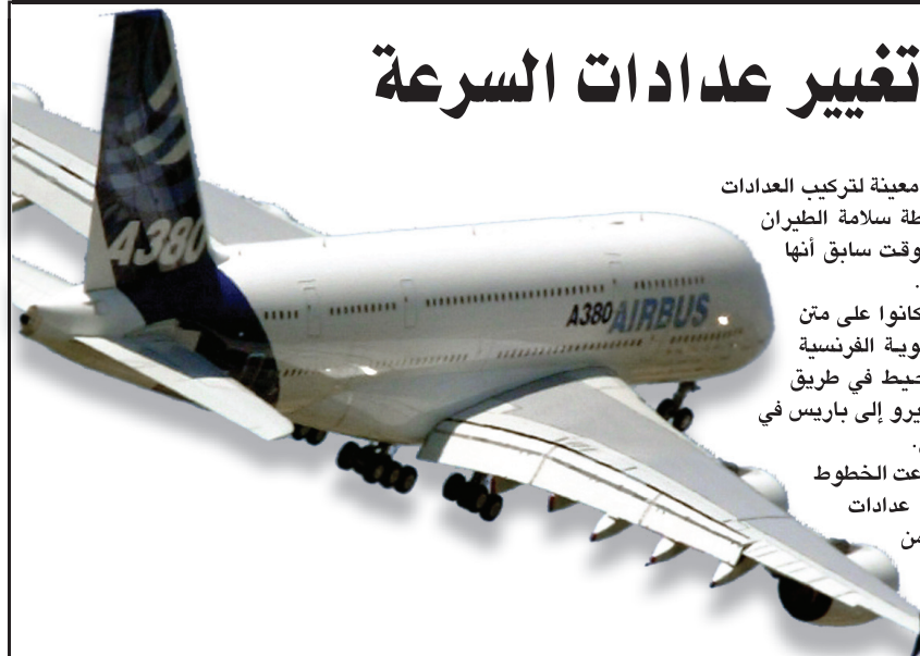
ولم تحدد الشركة مهلة معينة لتركيب العدادات الجديدة، وكانت سلطة سلامة الطيران الدولي قد أعلنت في وقت سابق أنها ستصدر توصية مماثلة.

لقد قررت إيرباص أن توصي بتغيير عدادات قياس السرعة في طائرات إيرباص A / ٣٣٠ Thales التي تعمل بنظام الأنايبب pitots أو استبدال اثنين من هذه القطع على الأقل بأنابيب Goodrich وأضاف ايبان: "إن هذا الإجراء الاحتياطي سيبيح لزيائنا الاستفادة من الخبرة الكبيرة لأنابيب Goodrich في طائرات A٣٣٠ / ٣٢٠". وسيعني هذا تغيير هذا النوع من الأنايبب التي تدخل في تركيب عدادات السرعة في نحو ٣٠٠ طائرة من طائرات إيرباص ٣٣٠ و ٣٤٠ والتي كانت تعتمد على عدادات قياس السرعة من الصناعة الفرنسية.