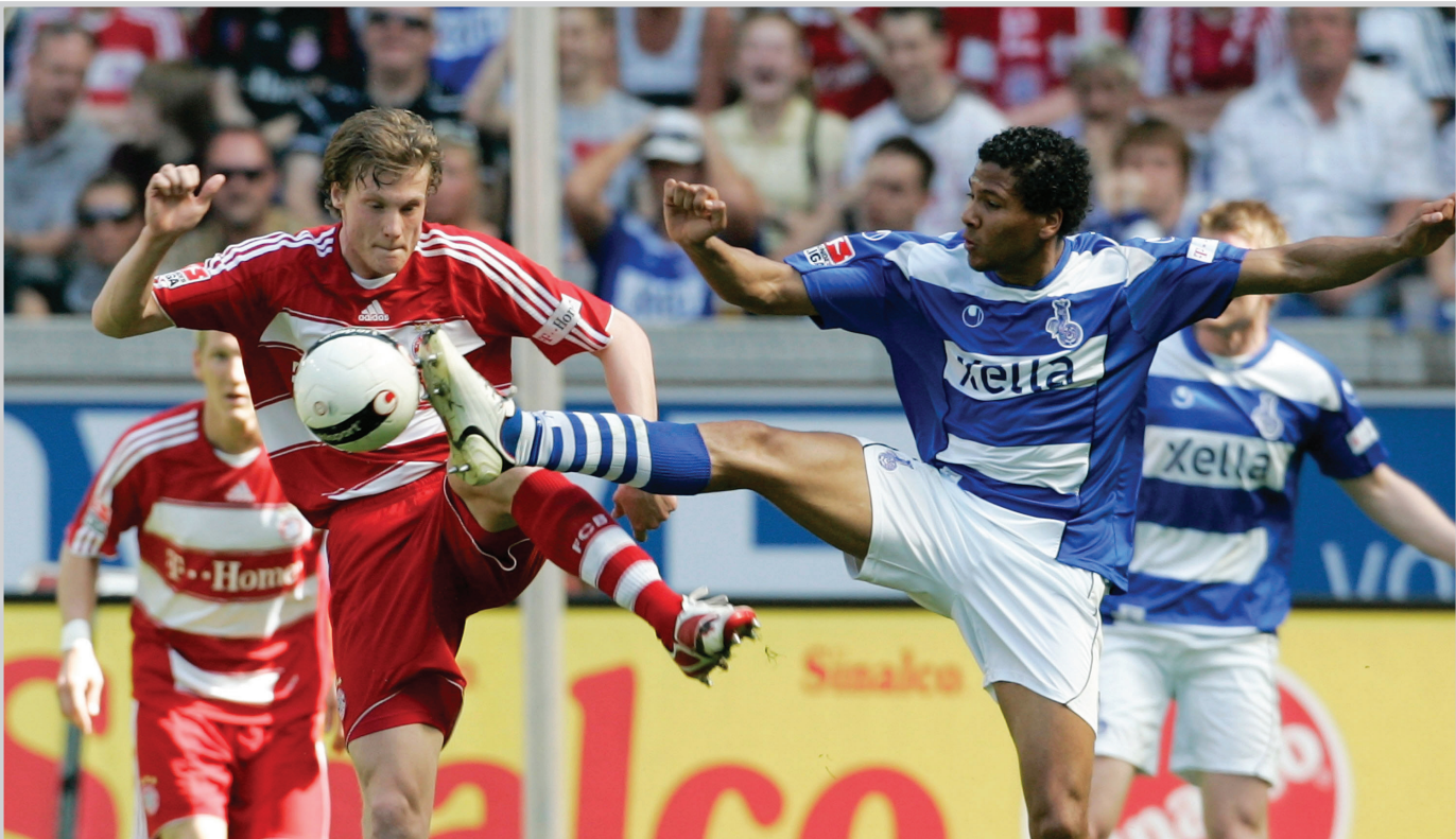
بايرن ميونيخ تسعى لخطف القاب الموسم الجديد

جميع القاب هذا الموسم وابرزها لقب بطولة كيار الاندية الأوروبية التي يرى بايرن ميونيخ مرشحا قويا للفوز بلقبها والتي تواجه في ملعب برنابيه في مدريد منتصف عام ٢٠١٠. وبذلك سيكون جميع اللاعبين قادة لبايرن ميونيخ لأن كل واحد منهم سيلعب دورا ايجابيا في ذلك، وهذا هو هدفه الاول والاخير في بايرن ميونيخ.!!!