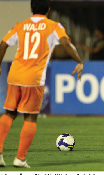
الدوري السعودي يكمل استعداده للانطلاق منتصف الشهر الخامس

الرياض / ا ف ب أجرت أندية دوري المحترفين السعودي لكرة القدم غربة شاملة على طواقيها الفنية استعدادا للموسم المقبل الذي سينطلق يوم الثلاثاء ١٨ آب الجاري، حيث تعاقدت ١١ منها مع مدربين جدد في الوقت الذي أبقي فيه الاتحاد البطل على مدربه الأرجنتيني غابريال كالديرون والفتح، الوافد الجديد، على مدربه التونسي فتحي الجبال. وفرضت المدرسة الأرجنتينية تواجدها بقوة في الأونة الأخيرة وباتت الاندية السعودية تتسابق من أجل التعاقد مع مدربين من بلاد التانغو بعد نجاحهم اللافت خلال السنوات الأخيرة ليسحبوا البساط من نظرائهم القادمين من المدرستين البرازيلية والأوروبية.