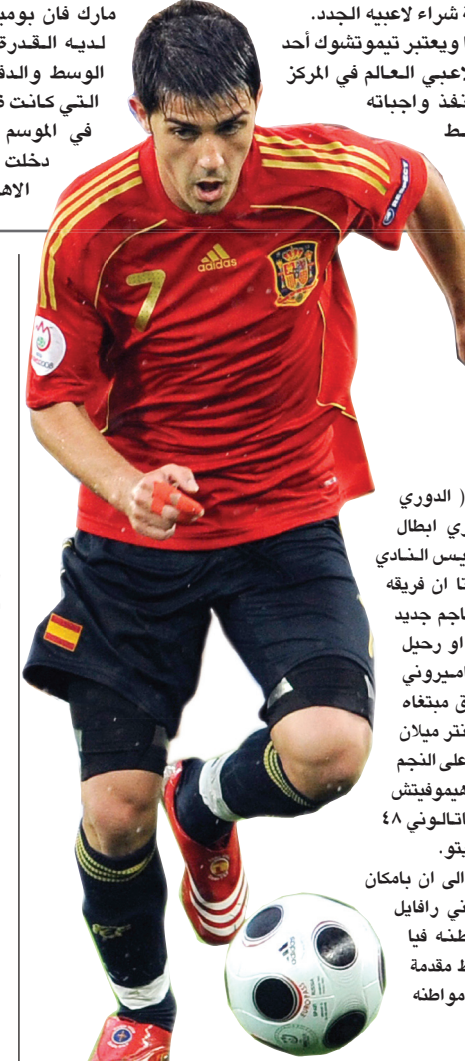
دايفيللا يلعب في صفوف المنتخب الإسباني

بيكن (ا ف ب) احرز توتنهام الإنجليزي لقب بطل دورة الصين الودية الرباعية على كأس آسيا في كرة القدم بفوزه على مواطنه هال سيتي ٣-٠ صفر في المباراة النهائية أمس الأول الجمعة على استاد العمال في بكين. ووقف الفريقان دقيقة صمت تكريما لروح مدرب منتخب انكلترا السابق السير بوبي رويسون الذي فارق الحياة عن سن ٧٦ عاما بعد